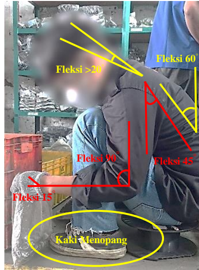
Gambar 4. 2 pengukuran RULA postur kerja lama (duduk)

Perhitungangan RULA pada postur kerja lama (duduk) dilakukan dengan mengambil sampel 1 orang operator pada bagian packaging . Postur kerja lama dan sudut perhitungan dapat dilihat pada gambar