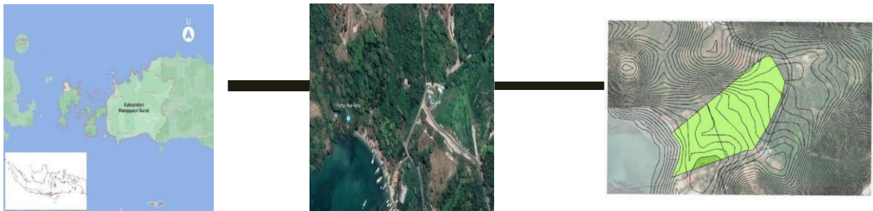
Gambar 1.1 area lokasi site terpilih