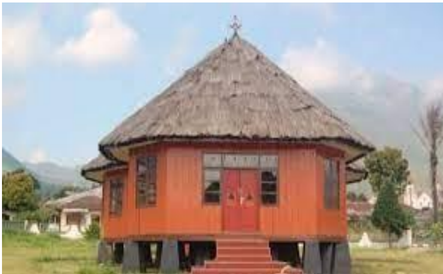
Gambar 1.4 rumah adat manggarai

Adapun desain bangunan yang menggunakan/ mengambil inspirasi dari rumah adat manggarai . Dimana bentuk atap kerucut di implementasikan ke bangunan resort seabagi pendekatan budaya dan membuat bangunan lebih terlihat ikonik