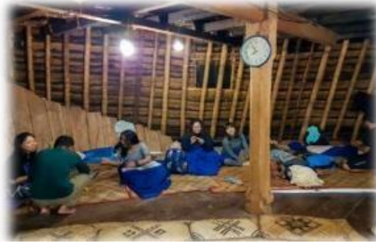
Gambar 1.3 area tengah (lutur) di rumah adat manggarai.