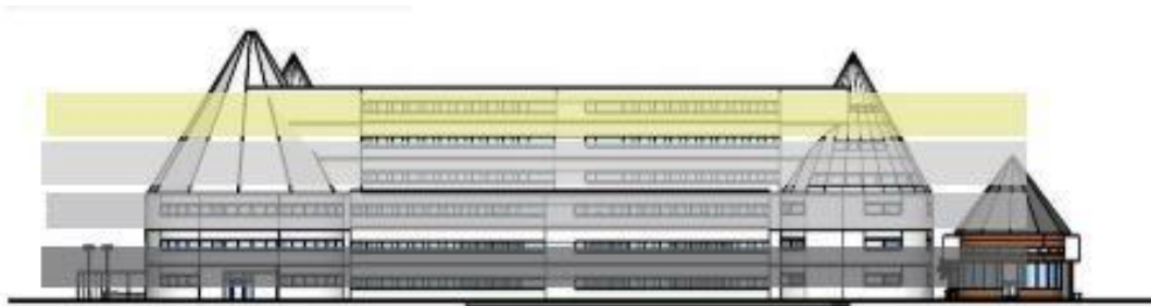
Gambar 1.6 transformasi bentuk bangunan utama

Konsep bangunan utama pun mengadaptasi konsep mbrau niang/ mbaru gendang.Yg mempunyai 5 tingkatan yaitu