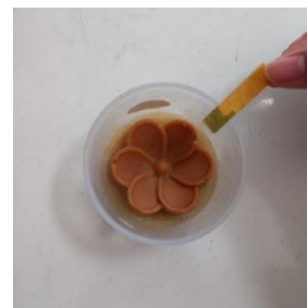
Gambar 2. Pengukuran pH sabun dengan pH meter

lumayan tinggi dapat meningkatkan kemampuan penyerapan kulit, menyebabkan rasa gatal, kulit mengelupas, dan kulit kering (Eka Margareth et al. , 2021). Hasil uji pH ditunjukkan pada gambar berikut.