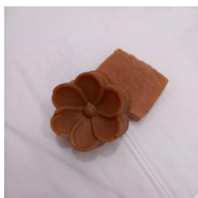
Gambar 1. Sabun dengan Ekstrak Serih Wangi, Kunyit, dan Lemon

Pengamatan fisik diperlukan untuk mendapatkan hasil uji organoleptic. Pengamatan yang dilakukan seperti menilai sifat fisik dan sensorik dari sabun, termasuk penampilan, aroma, dan tekstur. Uji organoleptik dilakukan untuk mendapatkan sabun padat ekstrak kunyit, serih wangi, dan lemon dengan tampilan warna yang menarik, aroma yang menyenangkan, dan desain sabun yang nyaman saat digunakan.