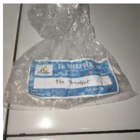
Gambar 1 Natrium Tiosulfat