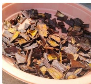
Gambar 4. Proses Pengeringan Kulit pisang