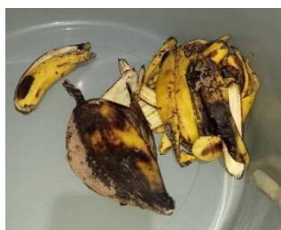
Gambar 5. Kulit pisang yang Bersih