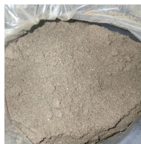
Gambar 6. Kulit pisang yang sudah di Giling