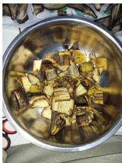
Gambar 2 Pemotongan kulit pisang menjadi persegi