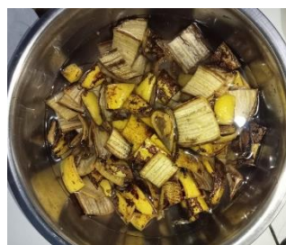
Gambar 3. Proses Perendaman Kulit pisang dengan Natrium Tiosulfat