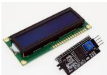
Gambar 3 . LCD 16 x2

Karena menghasilkan tampilan karakter yang baik dan cukup banyak, LCD adalah media tampilan yang paling mudah untuk diamati. Dimungkinkan untuk menampilkan 32 karakter pada LCD 16×2, dengan 16 karakter pada baris atas dan 16 karakter pada baris bawah. LCD 16×2 biasanya menggunakan 16 pin sebagai kontrol, jadi akan sangat boros. Oleh karena itu, dibutuhkan driver khusus untuk membiarkan LCD bekerja dengan jalur I2C, yang memungkinkan LCD bekerja dengan hanya 2 pin, yaitu SDA dan SCL[4].