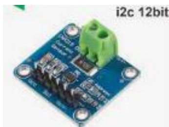
Gambar 2. Sensor Ina 219

Modul sensor INA219 memiliki kemampuan untuk memantau tegangan dan arus rangkaian listrik. INA 219 didukung oleh interface I2C atau SMBUS-COMPATIBLE. Ini memungkinkan peralatan untuk melacak tegangan shunt dan suplai tegangan bus, serta mengubah waktu program dan filtering. Input amplifier maksimum INA 219 adalah \pm 320\text{mV} , yang berarti dapat mengukur arus hingga \pm 3,2\text{A} . Dengan data internal 12 bit ADC, resolusi pada kisaran 3.2A adalah 0,8 mA, dan gain internal ditetapkan pada minimum div8, tegangan maksimum saat ini adalah \pm 400\text{mA} dan resolusi 0,1 mA. INA 219 juga mengidentifikasi tegangan shunt pada bus 0–26 V[3].