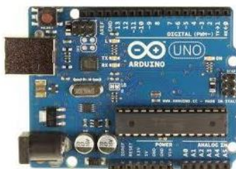
Gambar 1. Arduino Uno.

Arduino Uno adalah board mikrokontroler berbasis ATmega328 (datasheet). Memiliki 14 pin input dari output digital dimana 6 pin input tersebut dapat digunakan sebagai output PWM dan 6 pin input analog, 16 MHz osilator kristal, koneksi USB, jack power, ICSP header, dan tombol reset[2].