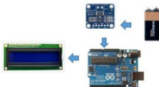
Gambar 4 . Blok Diagram Sistem

Berikut Blok diagram Sistem dalam pembuatan alat ini