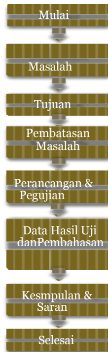
Gambar 1 alur proses perancangan

peroleh selama melakukan penelitian tersebut. Penelitian ini menggunakan dyno test. Metode yang dipakai disini dengan cara perancangan & pengujian.