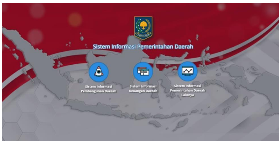
Gambar 2.7 Website Sistem Informasi Pemerintahan Daerah

SIPD ini ialah sistem informasi berbentuk aplikasi yang dibuat berbasis website sehingga dapat lebih mudah diakses kapanpun dan dimanapun. Adapun halaman website tersebut dapat diakses pada alamat sipd.kemendagri.go.id dengan tampilan awal sebagai berikut :