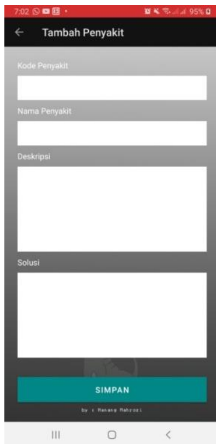
Gambar 3. Antarmuka Fitur Data Penyakit

Analisis kebutuhan tambahan mencakup spesifikasi dan kriteria sistem untuk fitur yang akan diuji. Ini penting sebagai pedoman atau standar dalam pengembangan test case pada fase berikutnya. Persyaratan dan spesifikasi sistem untuk fitur data penyakit dijelaskan dalam Tabel 1 dan Tabel 2.