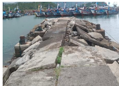
Gambar 4. Kolam labuh