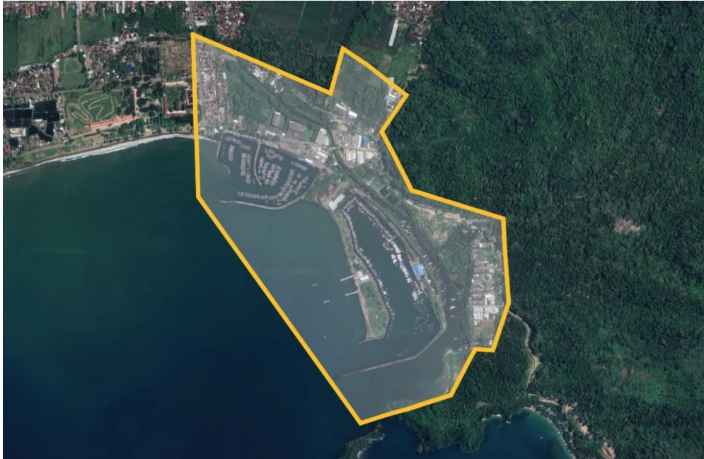
Gambar 2. Analisa site

Luas total Pelabuhan Perikanan Prigi adalah 27,5 hektar, 11,5 hektar berupa daratan dan 16 hektar berupa dermaga. Pemukiman Tasikmadu, Kecamatan Watulimo, Kabupaten Trenggalek, Provinsi Jawa Timur; koordinat: 111°43'58" BT, 08°17'22" LS. Masyarakat Prigi sangat bergantung pada industri perikanan karena potensinya, dan penangkapan ikan adalah sumber pendapatan utama mereka. Adapun peta eksisting tempat pengkajian bisa dicermati dibawah.