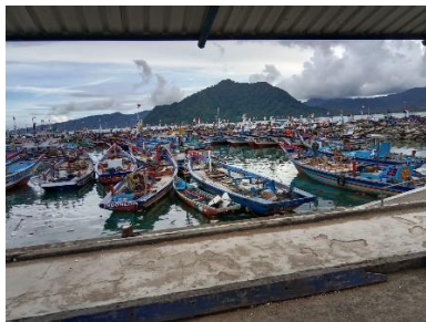
Gambar 3. Kolam labuh

Sarana pokok dengan ada pada pelabuhan perikanan prigi meliputi :lahan , kolam pelabuhan, breakwater,dermaga, revetment, jetty. Dari keseluruhan fasilitas pokok berdasarkan observasi dapat berfungsi dengan baik , hanya saja ada Sebagian yang perlu adanya perbaikan dan kolam labuh sudah seharusnya d kembangkan karena sudah terlalu sesak kapal .