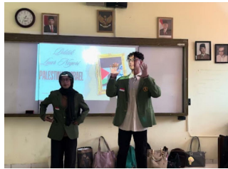
Gambar 1. Pelaksanaan pre-test