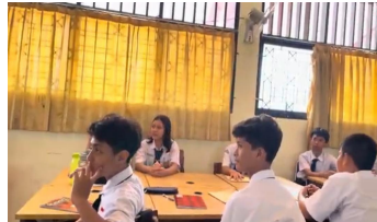
Gambar 2. Siswa mendengarkan pertanyaan pre-test

Sosialisasi yang dilakukan di SMP Negeri 37 Jakarta ialah terkait dengan pemahaman bagaimana politik luar negeri Palestina-Israel dan bagaimana sikap Indonesia dalam merespons konflik tersebut, serta melihat konflik Palestina-Israel dari sudut pandang Pancasila, Bela Negara, dan Agama. Dalam hal ini, dijelaskan juga kepada para siswa tentang peran ketahanan nasional dan tata kelola pemerintahan dalam merespons konflik Palestina-Israel. Kegiatan diawali dengan memberikan pertanyaan secara langsung secara interaktif dan diskusi kepada para siswa sebagai pre-test untuk mengetahui seberapa jauh pemahaman siswa mengenai politik luar negeri Palestina-Israel. Selanjutnya, para siswa melaksanakan pengisian post-test melalui Google Form untuk mengukur pemahaman siswa sebelum dan sesudah dijelaskan materi mengenai politik luar negeri Palestina-Israel. Adanya pre-test dan post-test ini bertujuan untuk mengukur sejauh mana keberhasilan penyampaian materi sosialisasi kepada target yang telah dituju, yaitu siswa SMP Negeri 37 Jakarta.