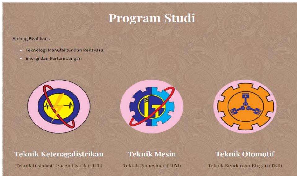
Gambar I.2 Logo Masing - masing Jurusan