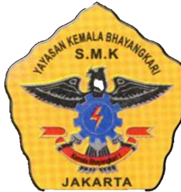
Gambar I.1 Logo Sekolah