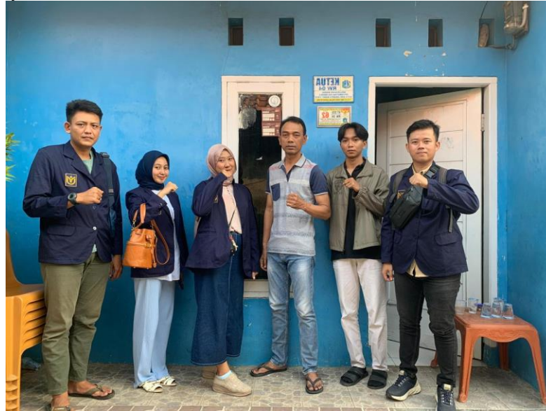
Gambar 2. Wawancara dengan Bapak RW. 04

Urbanisasi mulai terjadi di wilayah mereka sekitar tahun 2017, dengan pendatang yang semakin banyak dalam 6-7 tahun terakhir.