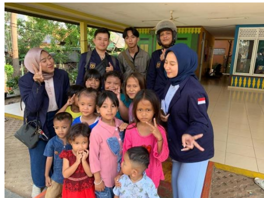
Gambar 3. Wawancara dengan Tokoh Masyarakat dan Anak-Anak Setempat