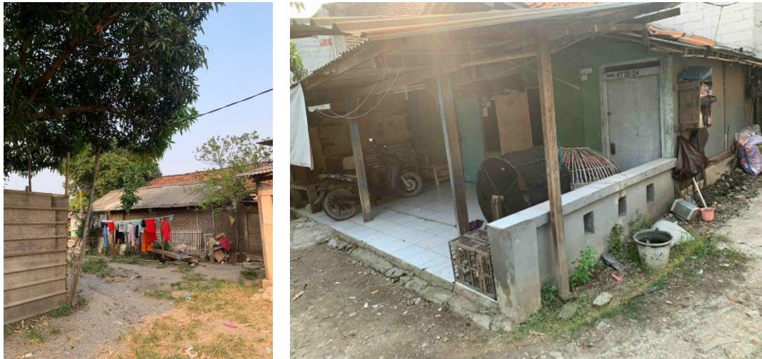
Gambar 4. Beberapa Kondisi Rumah Warga di RW. 04, Kelurahan Kamal.

Pusat pelatihan kerja daerah (PPKD) yaitu Satuan lembaga Pelatihan kerja yang dimiliki oleh Pemerintah daerah yang berada di Provinsi DKI Jakarta, yang dibawah langsung oleh Suku dinas Ketenagakerjaan Yang berada di setiap Kota. Salah satu PPKD berada di Jakarta Barat, letaknya di Jalan Kamal Raya nomor 2, RT 07/02 Kelurahan Tegal Alur, Kecamatan Kalideres.