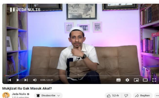
Gambar 3.3 Video Pertama

Pada video yang berjudul “Mukjizat itu gak masuk akal?” ini diunggah pada tanggal 18 September 2022 dengan jumlah viewer 109.516. Judul ini diambil Habib berdasarkan keresahan netizen terhadap orang yang tidak mempercayai mukjizat. Dalam video ini Habib menjelaskan mengenai mukjizat dengan sangat rasional. Adapun penyampaian dakwahnya sebagai berikut: