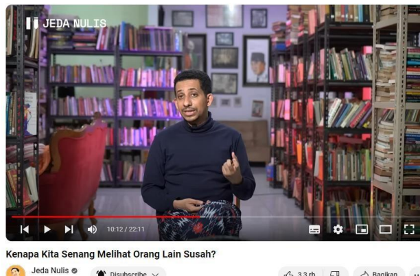
Gambar 3.6 video keempat

Pada video yang diupload di channel YouTube Jeda Nulis yang berjudul “kenapa kita senang melihat orang lain susah?” ini diunggah pada tanggal 2 Maret 2023 dengan jumlah viewer 104.362. Berdasarkan video ini Habib menjelaskan bagaimana sikap kita terhadap orang yang sedang mengalami kesusahan. Adapun isi video sebagai berikut: