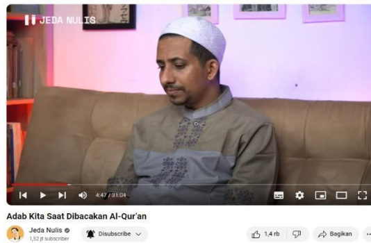
Gambar 3.7 video kelima

Pada video dalam channel Youtube Jeda Nulis yang berjudul “Adab kita saat dibacakan Al-qur'an” ini diunggah pada tanggal 13 Januari 2023 dengan jumlah viewer 37.650. Berdasarkan video dalam channel Jeda Nulis Habib menjelaskan sikap kita atau adab kita saat dibacakan Al-qur'an. Adapun isi video sebagai berikut: