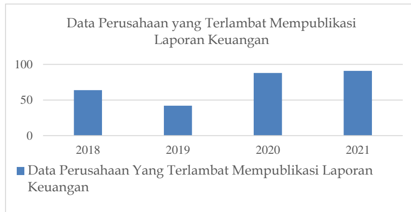
Gambar 1 Data perusahaan yang terlambat publikasi laporan keuangan tahunan.

berdasarkan POJK ini ditingkatkan menjadi Rp 1 juta dari sebelumnya maksimal Rp 500 juta atau Rp 500.000. Jika tadinya emiten hanya bisa menerima maksimal Rp 1 juta per hari, kini bisa mendapat maksimal Rp 2 juta. Perusahaan publik akan mengalami penurunan denda dari Rp100.000 per hari maksimum Rp100.000 menjadi Rp500.000 per hari, sedangkan emiten kecil dan menengah akan mengalami kenaikan menjadi Rp1 juta per hari.