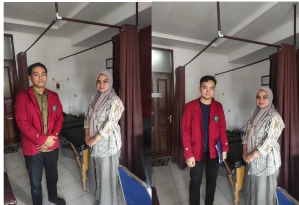
Gambar 1.2 Dokumentasi Wawancara Dengan Owner Skincare Adelia Beauty

Berdasarkan hasil wawancara dengan Pemilik beliau mengatakan “Pemberdayaan merupakan upaya untuk mengubah hubungan kekuasaan yang memaksa pilihan perempuan dapat mempengaruhi kesehatan dan kesejahteraan” hal ini dapat dimengerti bahwa perempuan mempunyai peran besar dalam usaha bisnis yang dibentuk.