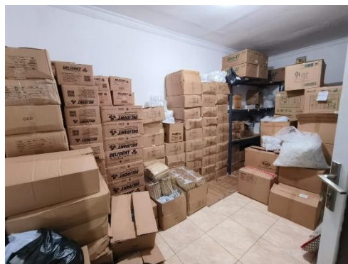
Gambar: 1.1 Tampak Gudang penyimpanan produk CV Adelia Medika Supply

Melihat peluang tersebut, berbekal dari usaha rumahan yang di mulai pada tahun 2019 CV Adelia Medika Supply memutuskan untuk memulai bisnis amenitiesnya. Berawal dari hanya 1 orang karyawan hingga saat ini telah berjumlah 9 karyawan yang di fasilitasi dengan 2 unit kendaraan operasional. Keputusan pimpinan CV Adelia Medika Supply untuk memulai bisnis amenities adalah karena pimpinan melihat peluang adanya permintaan akan produk-produk amenities hotel yang terus meningkat seiring dengan pertumbuhan industri perhotelan di Kota Bandung. Bahkan sampai saat ini cakupan pasar amenities CV Adelia Medika Supply tidak hanya untuk memenuhi beberapa Hotel di Bandung Raya saja, namun permintaan dan supply-nya saat ini telah mencapai ke luar Pulau Jawa.