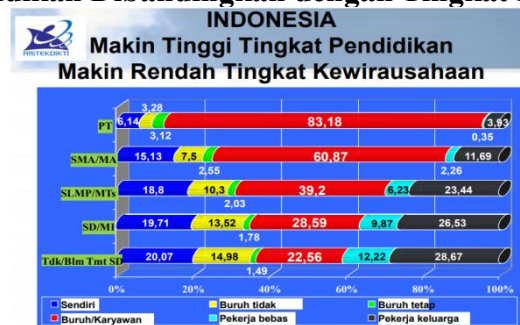
Diagram 1 Tingkat Pendidikan Dibandingkan dengan Tingkat Kewirausahaan

Sumber : (Suprayitno dalam Edi, Permasalahan Perguruan Tinggi dan Tantangan dan Relevansi Pendidikan Tinggi dengan dunia kerja.,2018)