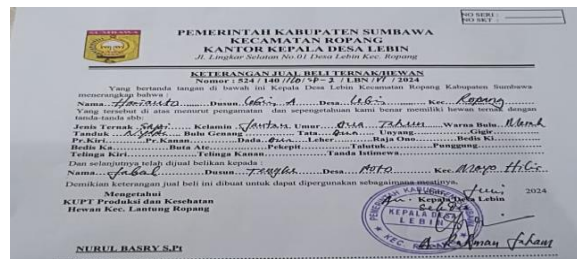
Gambar 4.11 Surat Jual Beli Ternak/Hewan

“kami tidak pernah melakukan pemungutan yang tidak tercantum dalam peraturan desa, yah biasanya kami hanya melakukan pemungutan ketika ada masyarakat disini yang menjual sapi/nya kepada orang diluar pada desa ini,kami melakukan pemungutan bukan kepada yang menjual melainkan kepada yang membeli”