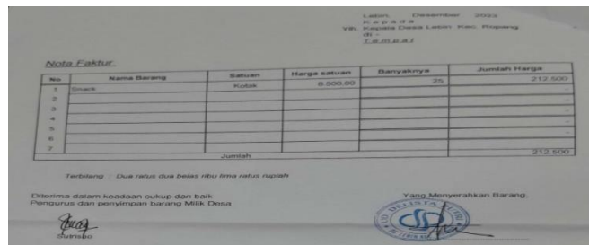
Gambar 4.10 Bukti Transaksi

3. Pemerintah desa dilarang melakukan pemungutan sebagai penerimaan desa selain yang ditetapkan dalam peraturan desa