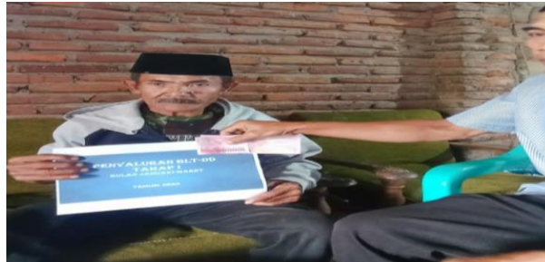
Gambar 4.6 Penerimaan BLT masyarakat desa lebin

“Nah ini untuk pelayanan bantuan sosial ada dek pemerintah desa menyediakan bagi masyarakat yang kurang mampu, untuk BLT juga diterima setiap 3 bulan sekali tetap diterima bagi masyarakat disini yang kurang mampu”