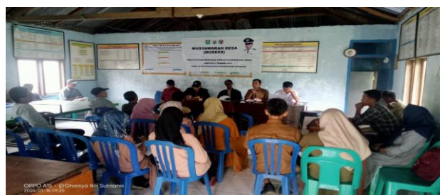
Gambar 4.7 Kegiatan Musdes Desa Lebin

Dalam akses penyampaian pendapat dan saran sudah berjalan baik, pemerintah desa menyediakan kotak saran sebagai sarana penyampaian keinginan masyarakat, pemerintah desa juga melakukan kegiatan-kegiatan desa atau diskusi santai untuk mendekati masyarakat, biasanya pendapat masyarakat di kumpulkan melalui musyawarah desa (MUSDES) yang diadakan setiap akhir tahun, pemerintah desa juga mengumpulkan pendapat dari tokoh-tokoh yang dianggap mewakili masyarakat banyak.