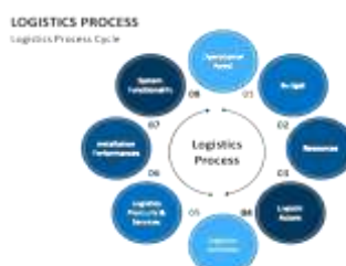
Gambar 1. Proses Logistik

Penelitian ini menggunakan metode kualitatif dengan melakukan survei kepada pelanggan