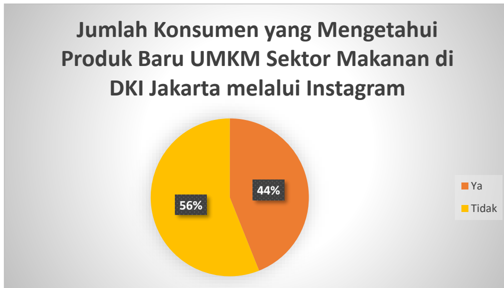
Gambar 1 2 Jumlah Responden yang Mengetahui Produk Baru UMKM Sektor Makanan di DKI Jakarta melalui Instagram