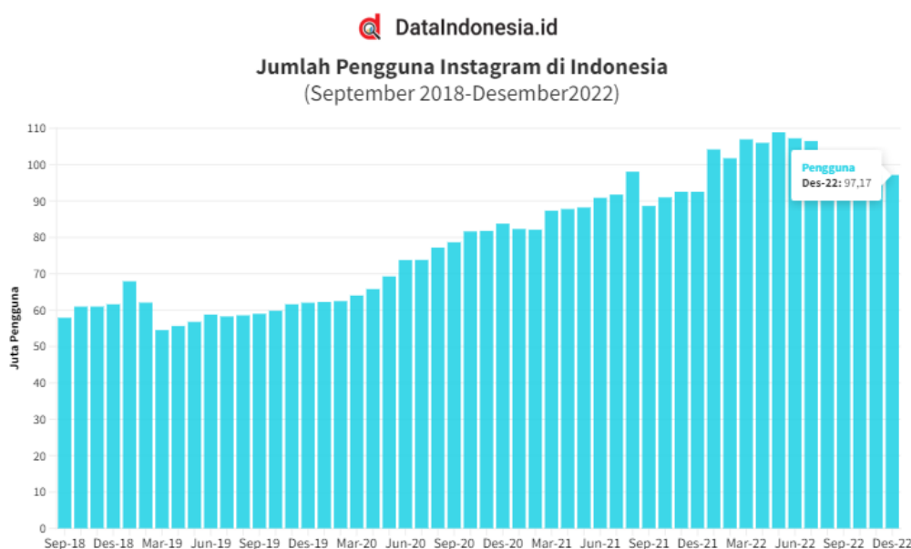
Gambar 1 1. Jumlah Pengguna Instagram di Indonesia

Berdasarkan survei Sea Insight yang dilansir katadata.co.id, (2020) sebanyak 54% responden pengusaha UMKM semakin adaptif menggunakan media sosial untuk meningkatkan penjualan. Instagram media sosial yang paling sering digunakan dari berbagai kalangan dan berbagai macam model bisnis untuk memasarkan produknya dengan konten-konten yang menarik berdasarkan data dari Napoleon Cat dalam dataindonesia.id (2023) jumlah pengguna Instagram di Indonesia sebanyak 97,17 juta hingga Desember 2022.