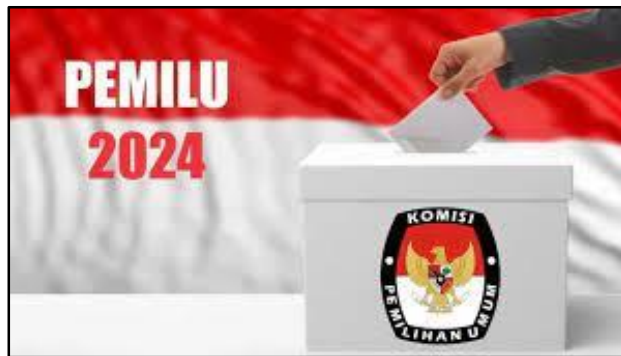
(Gambar 1 : Pemilu 2024)

Kemajuan teknologi komunikasi saat ini semakin mempermudah interaksi masyarakat. Mereka dapat berkomunikasi dengan berbagai cara, termasuk melalui media internet yang kini semakin populer digunakan oleh pelaku komunikasi. "Internet adalah hasil dari gabungan ribuan jaringan komputer yang saling bertukar data secara global. Ini mendorong kerjasama untuk mencapai tujuan bersama tanpa memiliki pemilik umum."