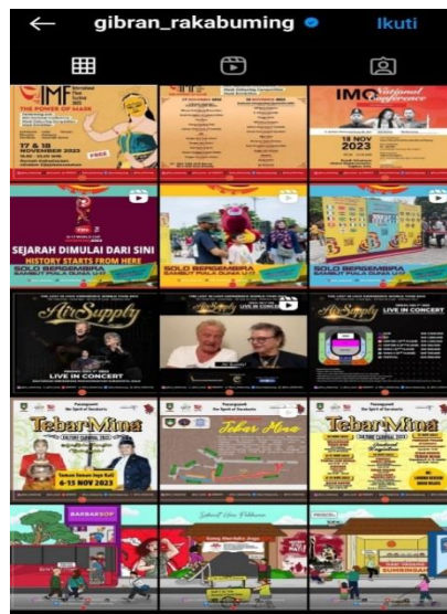
(Gambar 3 : Konten Instagram pada akun Gibran)

Dalam konten-konten dari Instagram milik kedua kadidat tersebut sangat menarik untuk dilihat oleh Masyarakat atau public sehingga public mengikuti konten-konten di Instagram. Hal merupakan bentuk kapanye yang berhasil melalui media sosial karena adanya konten-konten menarik di dalam akun Prabowo dan Gibran menjelang pilpres 2024.