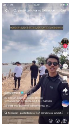
Gambar 4.1 Pandawara menyampaikan pesan verbal melalui konten TikTok

mudah dipahami dalam konten-konten yang telah diunggah pada akun TikTok mereka. Pandawara Group juga membuat konten yang menarik dan informatif yang lebih mudah menarik perhatian audiens. Pandawara juga membuat konten dalam berbagai bentuk, seperti video, GIF, atau postingan teks. Dalam konten tersebut, audiens dapat menemukan informasi tentang pentingnya kebersihan lingkungan, berbagai metode untuk memastikan kebersihan lingkungan, dan efek negatif dari kebersihan lingkungan yang buruk. Pandawara juga memanfaatkan visual yang menarik dalam pembuatan konten yang telah diunggah pada media sosial TikTok. Visual yang menarik dapat membuat konten lebih mudah diingat dan dibagikan oleh masyarakat. Visual juga dapat digunakan untuk menampilkan dampak sampah terhadap lingkungan, seperti polusi udara, air, dan tanah. Hal ini dapat membantu masyarakat untuk memahami pentingnya menjaga kebersihan lingkungan.