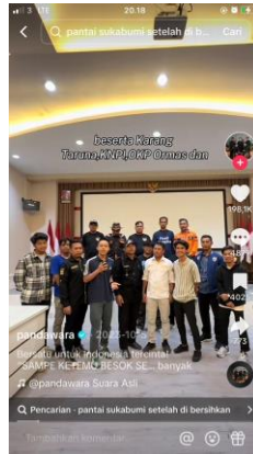
Gambar 4.2 Pandawara mengajak kolaborasi intansi atau organisasi setempat