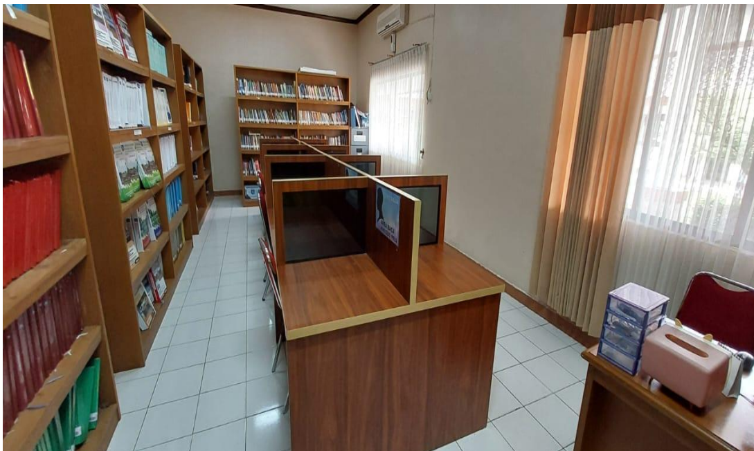
Gambar 2 Ruang Perpustakaan