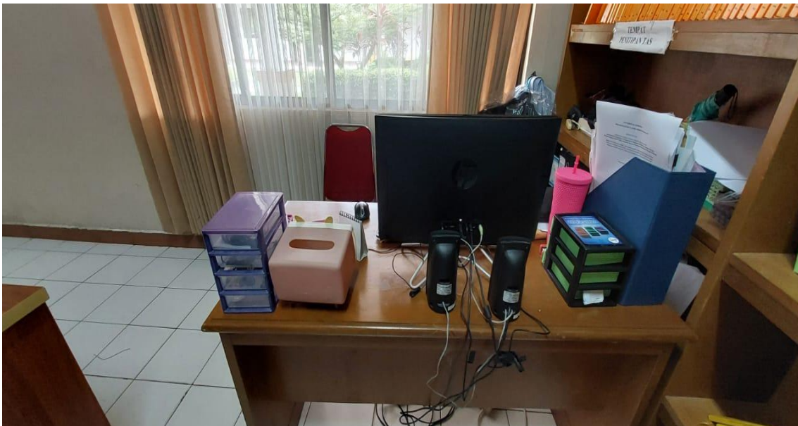
Gambar 4 Meja Operator