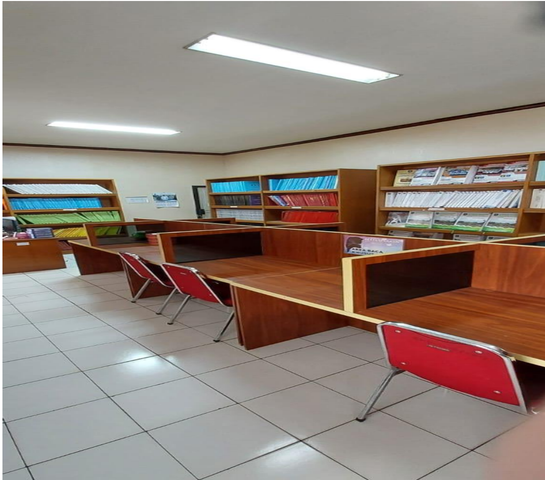
Gambar 3 Keadaan Perpustakaan