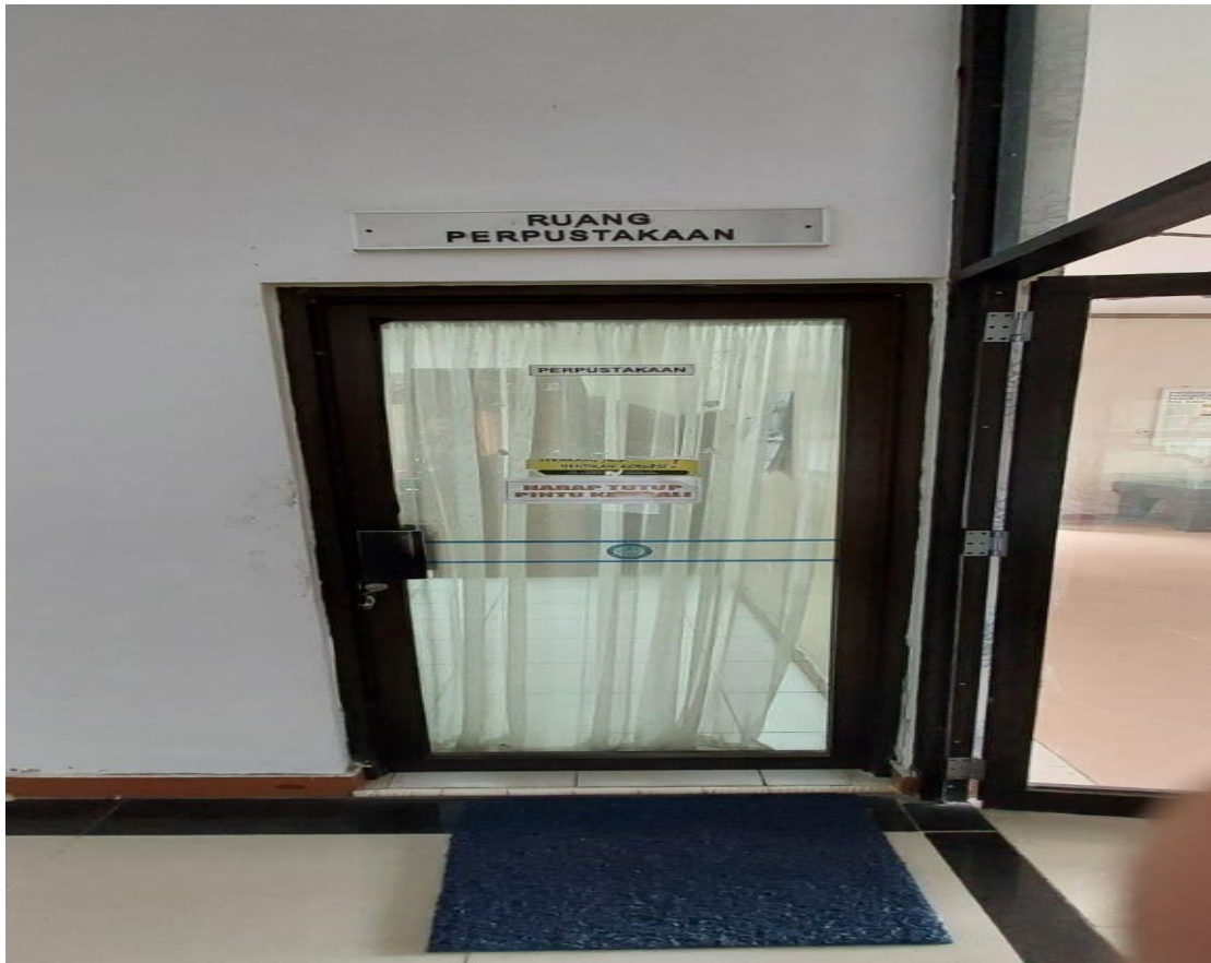
Gambar 1 Ruang Perpustakaan