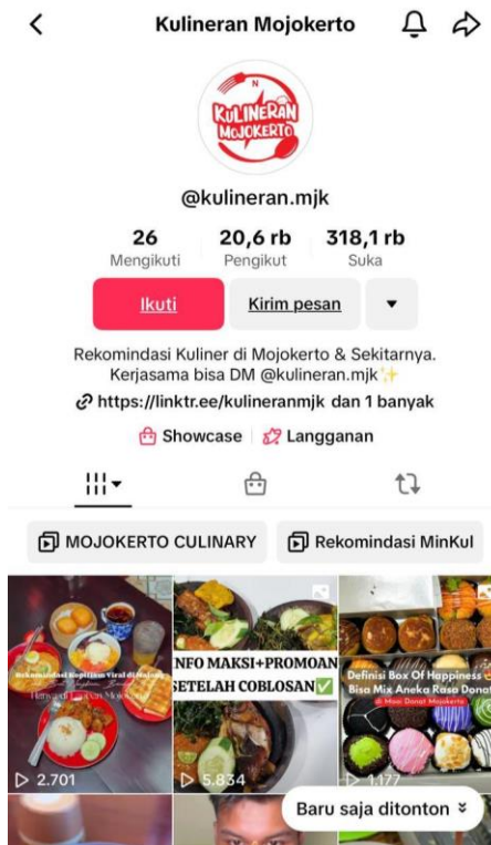
Gambar 2. Akun TikTok @kulineran.mjk

Dari hasil analisis penulis Generasi Z dikenal menyukai konten cepat yang informatif dan menghibur. Video pendek @kulineran.mjk yang menampilkan proses pembuatan makanan tradisional, seperti serabi atau rendang, memperkenalkan kuliner Nusantara dengan cara yang mudah dipahami dan menarik bagi audiens muda. Dan Generasi Z lebih terhubung dengan budaya lokal melalui medium yang mereka gunakan setiap hari. Menjaga relevansi tradisi kuliner di tengah dominasi makanan modern atau budaya global. Generasi Z sering mencari cara untuk memahami identitas budaya mereka di era globalisasi. Konten ini berperan sebagai jembatan, menghubungkan mereka dengan akar budaya melalui visualisasi makanan dan tradisi lokal.