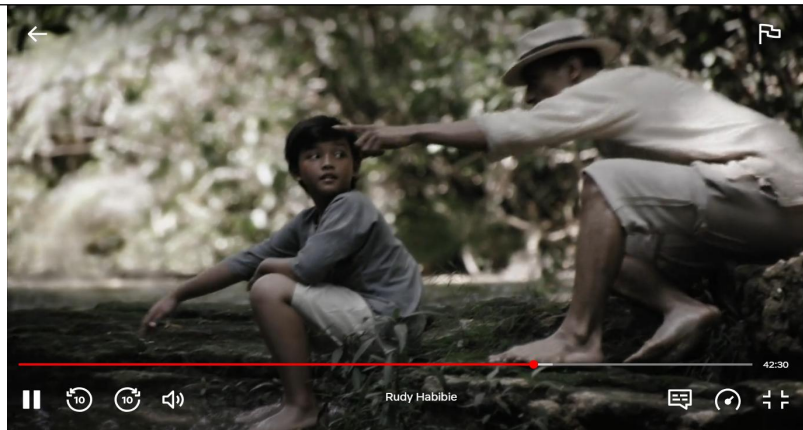
Gambar 4 : Scane 3