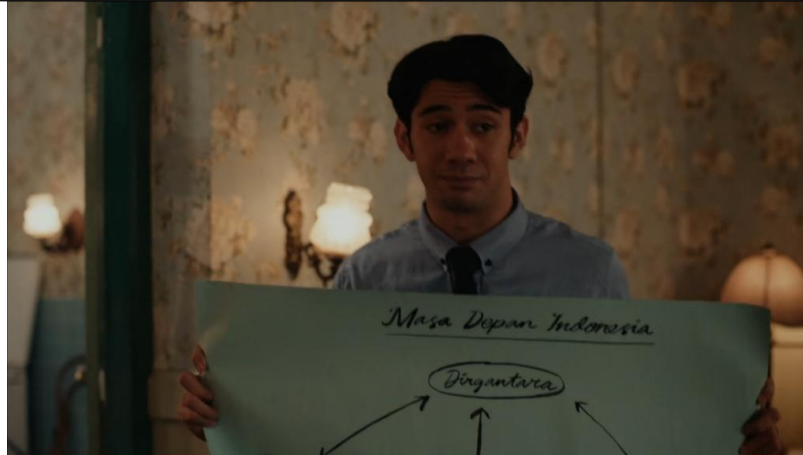
Gambar 3 : Scane 2