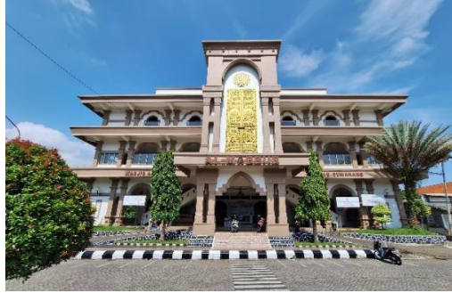
Gambar 1. Eksterior Masjid Agung Al- Mabrur, 2024

Masjid Agung Al- Mabrur Kabupaten Semarang berlantai tiga. Lantai pertama digunakan sebagai Gedung pertemuan IPHI dan memiliki fungsi sebagai Gedung pernikahan, lantai dua dan tiga (mezanin) difungsikan sebagai masjid. Desain bangunan masjid ini menggunakan pendekatan arsitektur tradisional Jawa Tengah, perpaduan antara gaya pesisir utara dan gaya pedalaman serta dipadukan dengan pendekatan arsitektur filosofi Islam. Arsitektur tradisional jawa merupakan gaya arsitektur yang penuh makna dalam Sejarah, keagamaan, kemasyarakatan, simbolik, estetika. Arsitektur jawa dianggap tidak bisa menciptakan bentuk sendiri, namun sudah menjadi jati diri Masyarakat Jawa (Silas, 1983, dalam Theodorus, 2020). 5