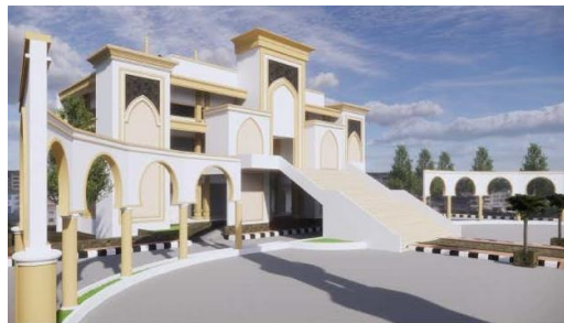
Gambar 8. Visualisasi Desain Undakan Masjid Agung Al-Maburr 2025

Perkembangan suatu bangunan/Kawasan biasanya identik dengan perubahan fisik. Namun evolusi yang terjadi pada Kawasan Masjid Agung Al- Maburr ini terlihat dari transformasi sosial dan budaya yang terjadi di dalam Masyarakat sekitarnya. Untuk menciptakan fasilitas yang lebih baik bagi umat, Pihak ulama' (IPHI) dan umaro (Pemerintah daerah) merencanakan perubahan pada bangunan Masjid Al- Maburr. Inovasi dari aspek desain arsitektur Masjid Agung Al- Maburr rencananya akan ada Pembangunan Undakan untuk akses menuju masjid yang tidak lagi melalui bawah atau melewati akses gedung pertemuan terlebih dahulu, melainkan langsung ke ruang utama masjid. Inovasi tersebut menunjukkan adanya kemajuan dalam perencanaan arsitektur dengan mempertimbangkan faktor kenyamanan dan keamanan para jamaah dan sebagai upaya mempermudah akses dan memberikan kesan megah pada bangunan Masjid Agung ini.