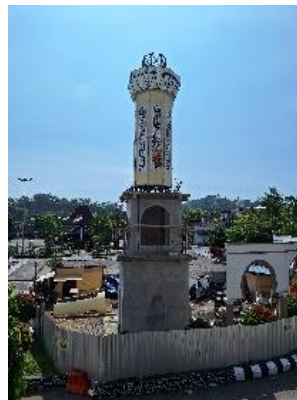
Gambar 11. Pembangunan Menara Masjid Agung Al -Mabrur,2024

Pada tanggal 9 Agustus 2024 Bupati Semarang Ibu H. Ngesti Nugraha, secara simbolis memulai proses pembangunan Menara Masjid Agung Al – Mabrur yang diawali dengan acara tradisi budaya jawa yaitu prosesi adat selamat Duduk Bumi untuk memohon kelancaran dan keberkahan dari Allah SWT. Tradisi duduk bumi ini juga dihadiri oleh ketua takmir Masjid Agung Al-Mabrur, H. Samsul Ridwan menyampaikan rasa terimakasih kepada Pemerintah Kabupaten Semarang atas dukungannya dalam mewujudkan Pembangunan Menara masjid ini dan Menara ini berfungsi untuk memberikan isyarat visual komunitas muslim serta tempat mengumandangkan panggilan shalat atau adzan. Tradisi tersebut menjadi momen penting bagi Masyarakat sekitar dan umat muslim secara keseluruhan. Menara ini sebagai simbol kekuatan iman dan identitas budaya yang saling bersinergi.