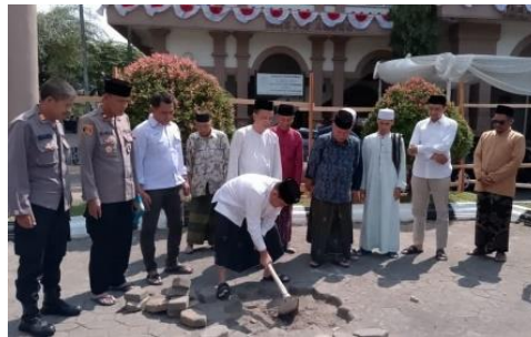
Gambar 10. Tradisi Duduk Bumi Masjid Agung Al- Mabrur, 2024