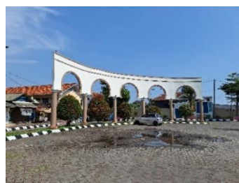
Gambar 7. Area Parkir Masjid Agung Al-Maburr, 2024

Mihrab dalam arsitektur masjid yang berfungsi sebagai pertanda arah kiblat merupakan inovasi arsitektur islam yang memiliki dimensi sosial budaya. Pada umumnya mihrab di rancang dengan memperlihatkan ketinggian derajat suatu kaum dan dihiasi ornament kaligrafi beraneka ragam bentuk maupun materialnya. Desain Mihrab Masjid Agung Al- Maburr berwarna krem atau coklat muda di hiasi dengan 12 ornamen bunga, perpaduan garis vertikal – horizontal yang terkesan elegan yang dapat menciptakan suasana yang tenang dan damai. 7