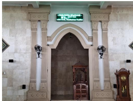
Gambar 6. Mihrab Masjid Agung Al- Maburr, 2024

Adanya simbol 2 menara dan 1 ka'bah di desain jendela masjid yang terinspirasi dari logo IPHI (Ikatan Persaudaraan Haji Indonesia) dan Pemda (Pemerintah Daerah) dapat menciptakan identitas visual yang akan memperkuat rasa kebersamaan dan spiritualitas di kalangan umat islam dan menjadi pusat kegiatan keagamaan sosial.