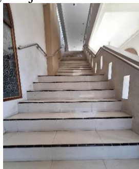
Gambar 4. Tangga Masjid Agung Al- Maburr, 2024

Masjid ini Berdiri kokoh dengan adanya 99 buah tiang penyangga atau tiang struktur yang berbagai macam ukuran melambangkan jumlah nama Allah SWT (Asmaul Husna).