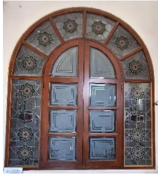
Gambar 5. Jendela Masjid Agung Al- Maburr, 2024

Adanya simbol 2 menara dan 1 ka'bah di desain jendela masjid yang terinspirasi dari logo IPHI (Ikatan Persaudaraan Haji Indonesia) dan Pemda (Pemerintah Daerah) dapat menciptakan identitas visual yang akan memperkuat rasa kebersamaan dan spiritualitas di kalangan umat islam dan menjadi pusat kegiatan keagamaan sosial.