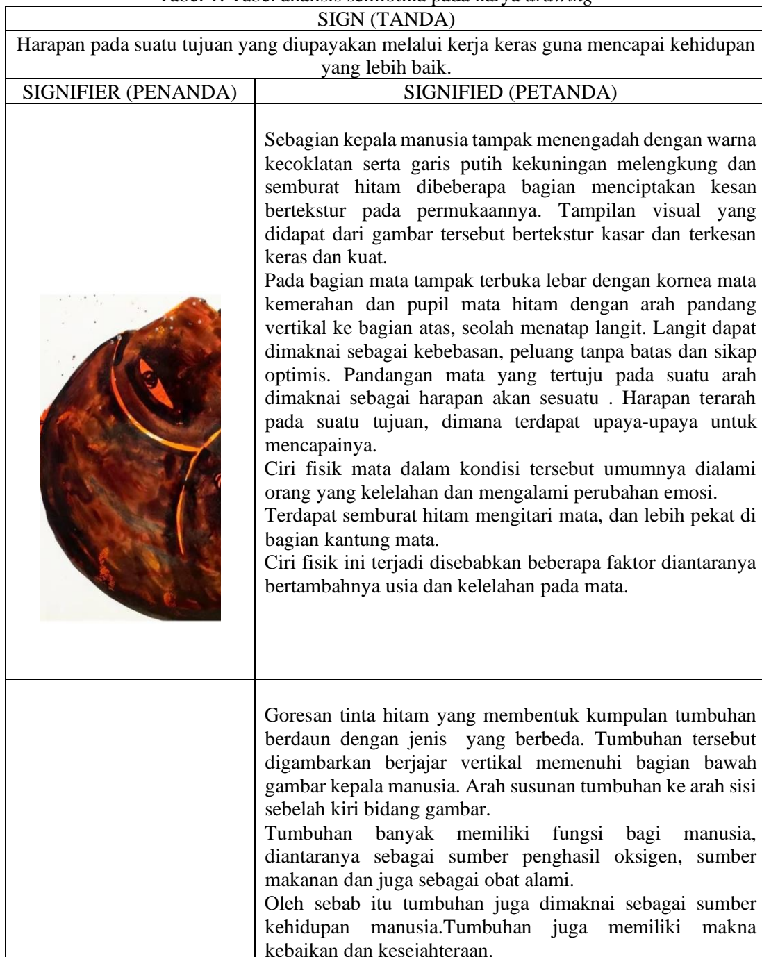
Tabel 1. Tabel analisis semiotika pada karya drawing

berwarna di bagian belakang kursi. Terdapat pula bercak cat berukuran kecil dan tipis pada bagian latar.