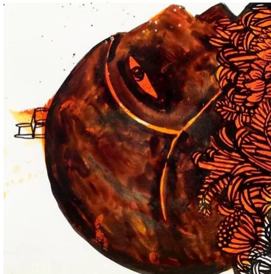
Gambar 2. Karya Drawing “ The Next Hope ” (Bayu Widodo, 2023)

Suatu sign (tanda) terbentuk dari signifier (penanda) suatu aspek material dan signified (petanda) suatu aspek mental (Sobur, 2004). Saussure mengemukakan bahwa sign (tanda) bersifat arbiter atau bebas, merupakan satu kesatuan antara signifier (penanda) dan signified (petanda), keduanya yang tidak dapat dipisahkan (Saussure, 1959). Kajian semotika ini akan mengurai makna dari karya drawing Bayu Widodo yang berjudul “ The Next Hope ” berukuran 25 cm X 25 cm. Karya gambar dibuat pada tahun 2023. Pencipta menggunakan media cat akrilik, tinta cina pada kertas. Adapun alat yang digunakan dalam proses pembuatan karya ini adalah kuas, yang digunakan untuk membentuk objek dan mewarnai permukaan objek gambar.