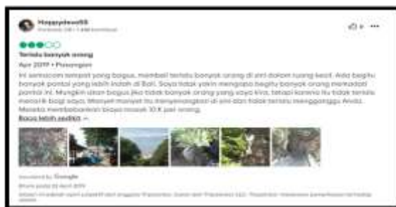
Gambar 4.2 Ulasan Wisatawan

Selain masalah kepadatan berupa kesesakan yang dirasakan pengunjung, masalah yang terjadi adalah masalah sampah masalah sampah disebabkan oleh kurangnya kesadaran wisatawan terkait kebersihan lingkungan. Selain itu, sampah yang ada di Pantai Labuan Sait merupakan sampah kiriman yang biasanya akan terjadi pada musim hujan. Pada tahapan ini, daya tarik wisata sudah tidak lagi populer di kalangan wisatawan. Hal ini berdasarkan berbagai ulasan wisatawan pada tahun 2018 hingga 2019. Gambar 4.2 berikut ini merupakan ulasan wisatawan pada tahun 2019 :