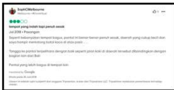
Gambar 4.1 Ulasan Wisatawan

Dengan jumlah kunjungan wisatawan yang meningkat, menimbulkan beberapa permasalahan di Pantai Labuan Sait. Hal ini berkaitan dengan kondisi komponen 4A dimana kegiatan pariwisata berdampak pada lingkungan dan atraksi alam yang ada. Berikut ini merupakan data sekunder terkait kepadatan di Pantai Labuan Sait diperoleh dari ulasan wisatawan pada gambar 4.1 berikut ini :