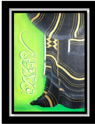
Gambar 5 “Karya 5 Uis Benang Iring”

Judul : Uis Benang Iring Ukuran : 50 x 70 cm Media : Kanvas dan cat akrilik Tahun : 2023 Seniman : Nur Apriana