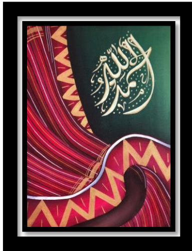
Gambar 7 “Karya 7 Uis Beka Buluh”