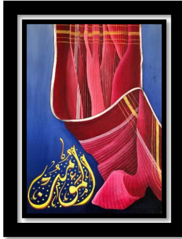
Gambar 11 "Karya 11 Uis Nipes Ragi Barat"

Judul : Uis Nipes Ragi Barat Ukuran : 50 x 70 cm Media : Kanvas dan cat akrilik Tahun : 2023 Seniman : Nur Apriana Br. Sinulingga