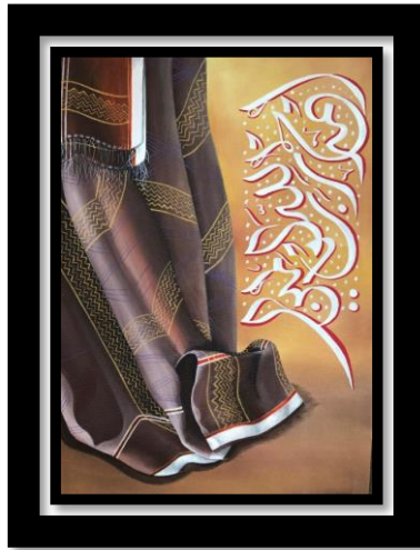
Gambar 6 “Karya 6 Uis Gatip”