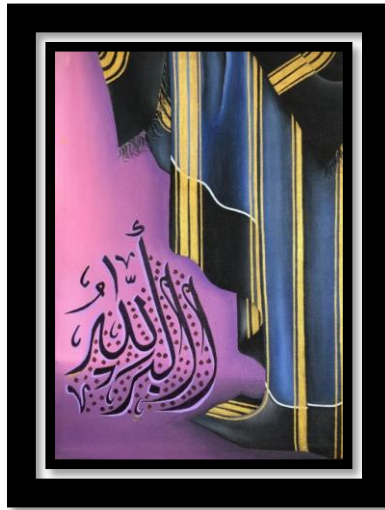
Gambar 4 “Karya 4 Uis Julu Diberu”

Judul : Uis Julu Ukuran : 50 x 70 cm Media : Kanvas dan cat akrilik Tahun : 2023 Seniman : Nur Apriana Br. Sinulingga