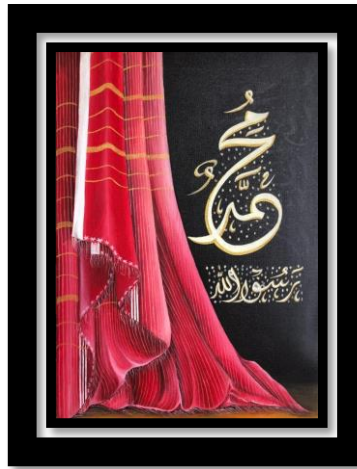
Gambar 8 “Karya 8 Uis Nipes Ragi Barat” (Sumber : Dokumen Nur Apriana, 2024)