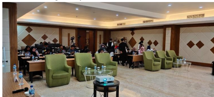
GAMBAR 1. 8 PELATIHAN BRANDING