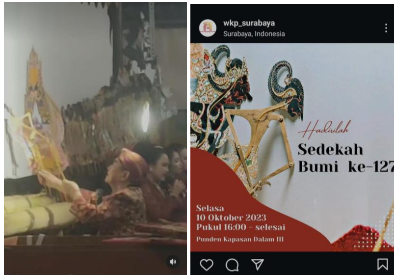
GAMBAR 1. 4 SEDEKAH BUMI KE-127 WKP KAPASAN DALAM 2023