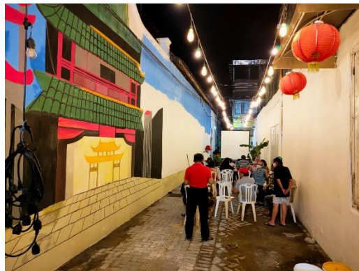
GAMBAR 1. 3 RAPAT BERSAMA WARGA KAPASAN DALAM