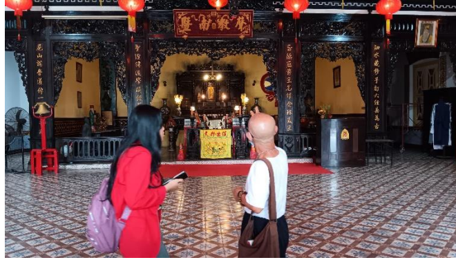
GAMBAR 1. 5 MENGUNJUNGI KELENTHENG BOEN BIO WKP KAPASAN DALAM