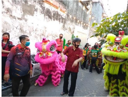
GAMBAR 1. 6 BARONGSAI DI ACARA PERESMIAN WKP KAPASAN DALAM