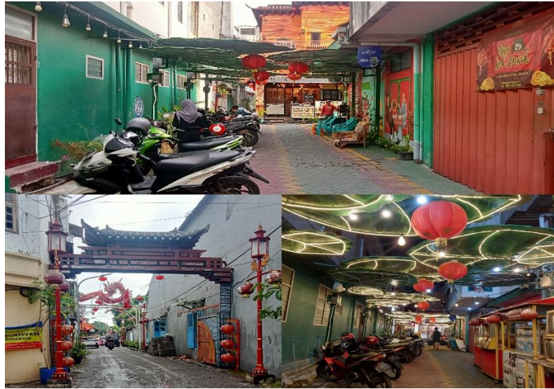
GAMBAR 1. 7 WISATA KAMPUNG PECINAN KAPASAN DALAM SURABAYA TAHUN 2024