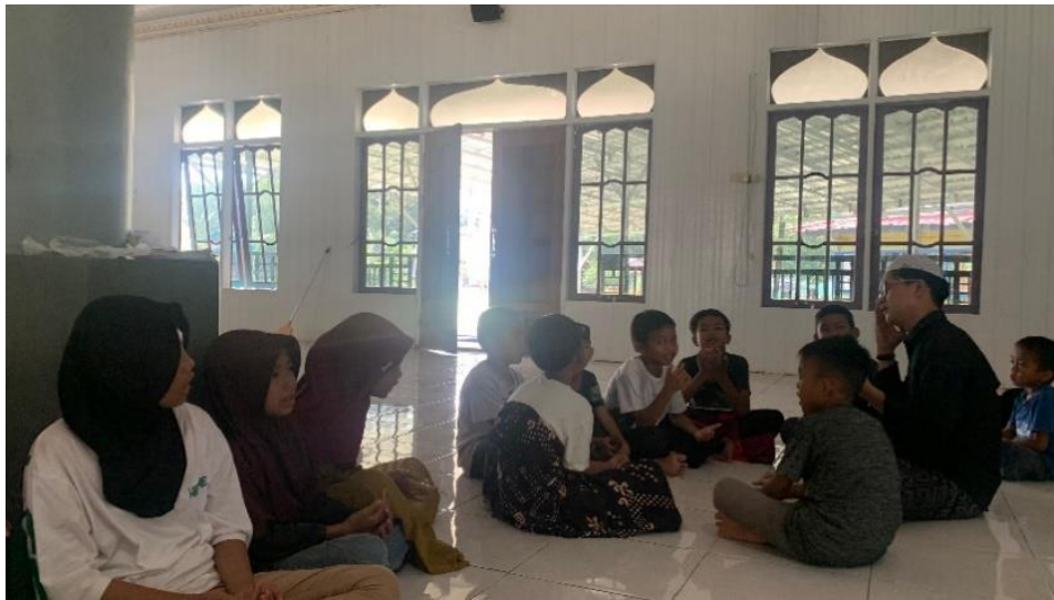
Gambar 1. Wawancara dengan Siswa di TPA