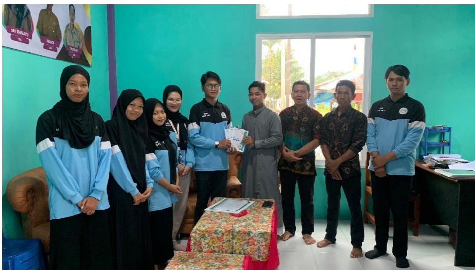
Gambar 2. Penyerahan Bahan Ajar

Bahan ajar baru ini diuji coba dalam kegiatan KKN dan mendapatkan tanggapan positif dari siswa dan pengajar. Berdasarkan pengamatan selama kegiatan, sekitar 75% siswa menunjukkan peningkatan minat belajar dan keaktifan dalam kelas setelah penerapan bahan ajar baru. Pengajar juga merasa terbantu dengan adanya bahan ajar yang lebih terstruktur dan mudah digunakan, yang membuat proses pembelajaran menjadi lebih lancar dan efektif.