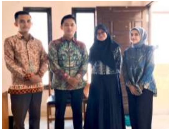
Gambar 2. Proses wawancara dan diskusi bersama pengurus organisasi Mualaf Center Indonesia Kota Palangka Raya

untuk meminta izin untuk mengadakan kegiatan pengabdian kepada masyarakat serta bertanya apa saja yang dibutuhkan oleh para mualaf yang ada di MCI Kota Palangka Raya, dapat dilihat di gambar 2. Setelah pertemuan tersebut, diskusi dan tahap perencanaan dilakukan secara online melalui Whatsapp. Hasil diskusi dengan pihak pengurus MCI Kota Palangka Raya menetapkan bahwa kegiatan pengabdian masyarakat yakni, “Pembinaan Agama Islam pada Mualaf Binaan Mualaf Center Indonesia Kota Palangka Raya” dilaksanakan pada tanggal 4, 11, dan 25 Agustus 2024.