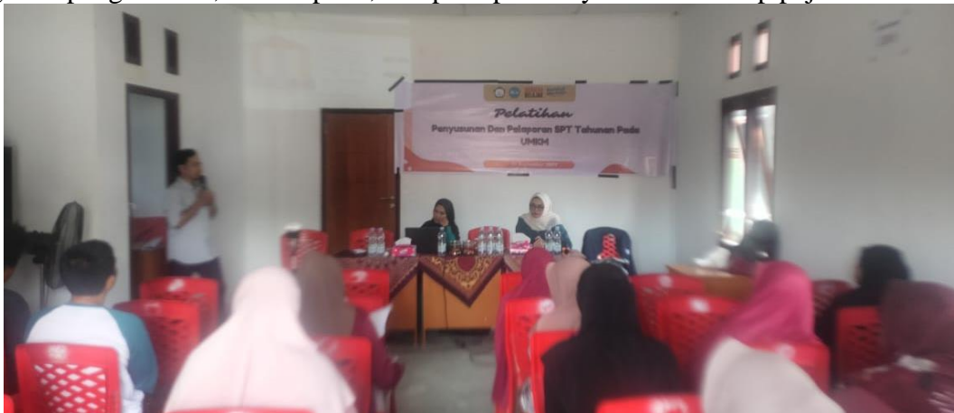
Gambar 3 Materi

Penyuluhan pajak, yang merupakan salah satu inisiatif yang mendukung pemerintah, ditetapkan berdasarkan Pedoman yang diterbitkan oleh Direktur Jenderal Pajak melalui Surat Edaran Nomor: SE-98/PJ/2011. Dalam pedoman tersebut, definisi penyuluhan pajak diartikan sebagai serangkaian tindakan dan proses pemberian wawasan perpajakan, yang bertujuan untuk mengubah pengetahuan, kemampuan, dan persepsi masyarakat terhadap pajak.