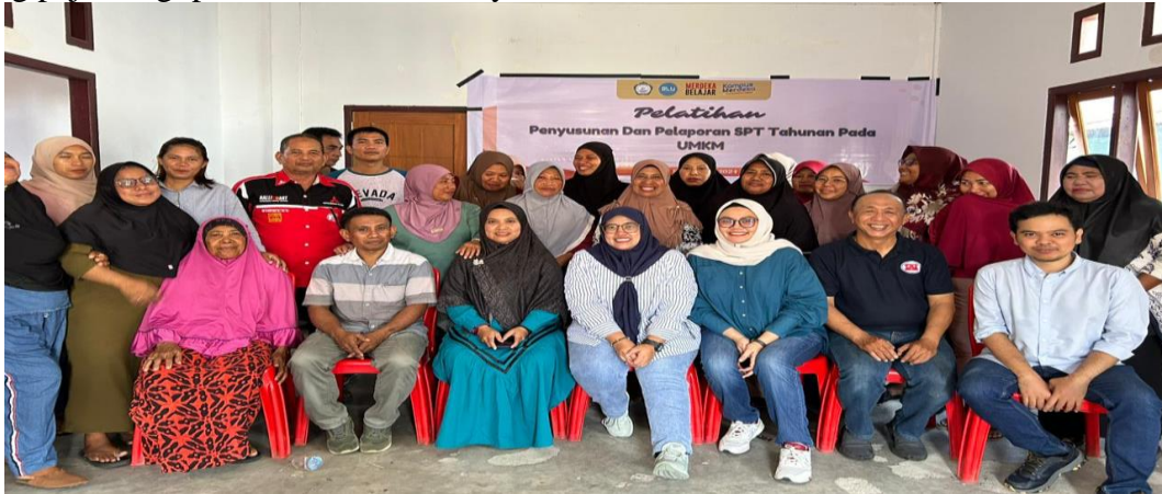
Gambar 4 Foto Bersama Tim PKM dan Peserta

masyarakat, serta lain-lain disediakan oleh pemerintah. Sebab itu, pentingnya kesadaran warga tentang pajak bagi pemerintah serta masyarakat itu sendiri.