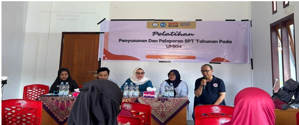
Gambar 2 Pembukaan Kegiatan

Penyuluhan pajak, yang merupakan salah satu inisiatif yang mendukung pemerintah, ditetapkan berdasarkan Pedoman yang diterbitkan oleh Direktur Jenderal Pajak melalui Surat Edaran Nomor: SE-98/PJ/2011. Dalam pedoman tersebut, definisi penyuluhan pajak diartikan sebagai serangkaian tindakan dan proses pemberian wawasan perpajakan, yang bertujuan untuk mengubah pengetahuan, kemampuan, dan persepsi masyarakat terhadap pajak.