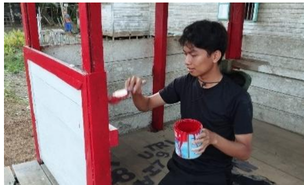
Gambar 11. Pengecatan Gapura, Pos Siskamling, dan Plang Nama Desa