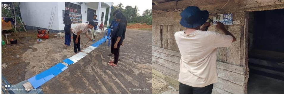
Gambar 9. Pembuatan Nomor Rumah