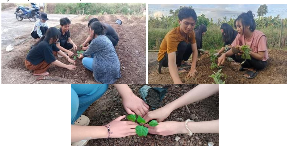
Gambar 2. Proses Penanaman Bibit TOGA dan Ketahanan Pangan

Setelah lahan siap, siswa melakukan penanaman bibit tanaman organik seperti sayuran, buah-buahan, dan umbi-umbian.