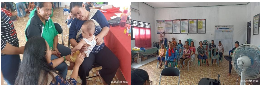
Gambar 8. Posyandu Balita dan Lansia

Dalam kegiatan ini, mahasiswa KKN membantu dalam pelaksanaan posyandu dengan melakukan pengukuran berat badan, tinggi badan, lingkar kepala, dan lingkar lengan anak-anak balita. Adapun kegiatan Posyandu Lansia yang berlangsung dengan penuh semangat dan antusiasme. Kegiatan ini dimulai dengan senam bersama yang diikuti oleh para lansia, di mana mereka berolahraga dengan gembira dan penuh energi. Senam ini dipandu oleh mahasiswa dan bidan desa yang bertugas, bertujuan untuk meningkatkan kebugaran fisik dan semangat hidup para lansia.