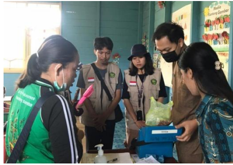
Gambar 7. Pekan Imunisasi Nasional