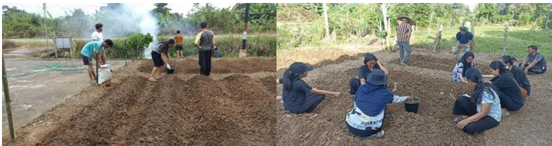
Gambar 1. Proses Penyiapan Lahan Taman TOGA dan Ketahanan Pangan

Mahasiswa melakukan penyiapan lahan yang akan digunakan untuk Taman TOGA. Lahan tersebut dibersihkan dan diolah untuk memastikan ketersediaan nutrisi yang baik bagi tanaman.