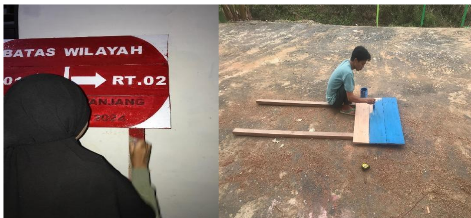
Gambar 12. Pembuatan Batas Wilayah RT

Mahasiswa membantu masyarakat dalam pembuatan batas wilayah RT yang jelas. Hal ini bertujuan meningkatkan perdamaian lingkungan dan meningkatkan keterlibatan masyarakat dalam kegiatan kebersihan lingkungan.