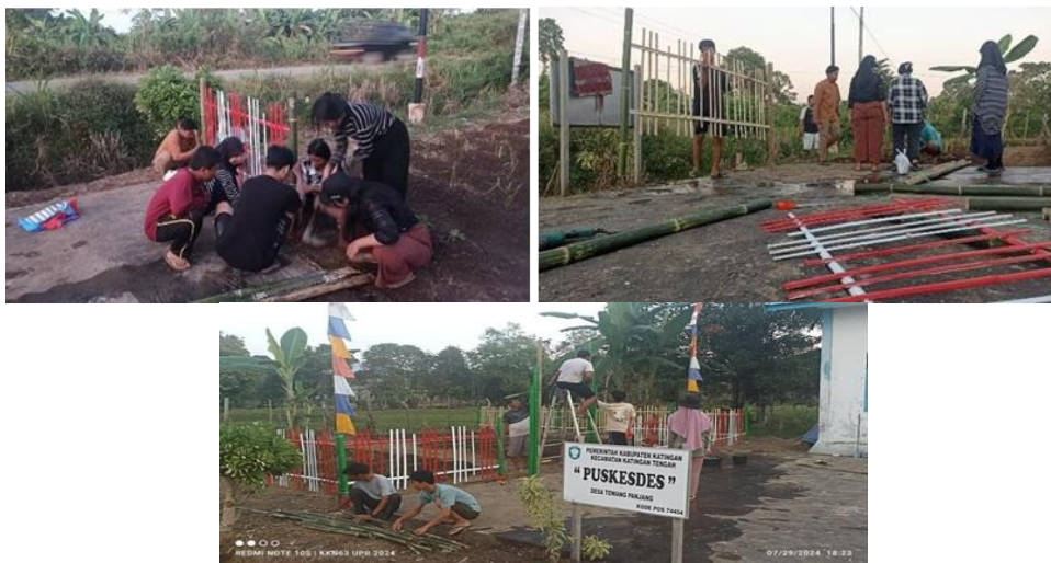
Gambar 4. Pembuatan Pagar Taman TOGA dan Ketahanan Pangan

Untuk menjaga keamanan dan kebersihan taman, mahasiswa KKN membuat pagar yang terbuat dari bahan-bahan lokal