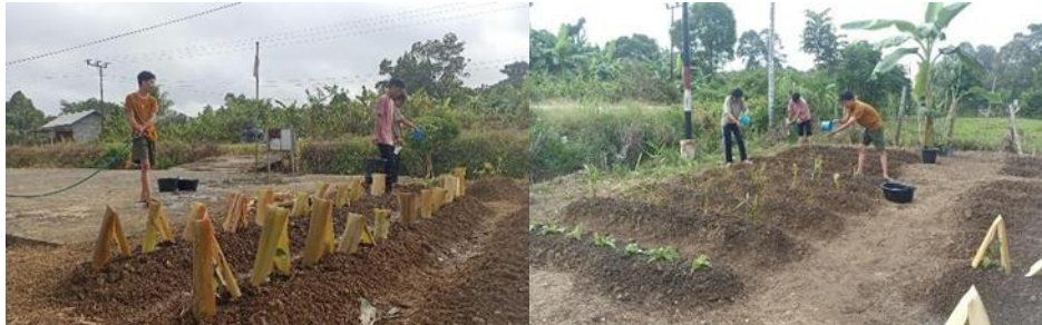
Gambar 3. Perawatan Tanaman TOGA dan Ketahanan Pangan

Mahasiswa melakukan perawatan tanaman secara teratur, termasuk penyiraman, pemupukan, dan pengendalian hama.