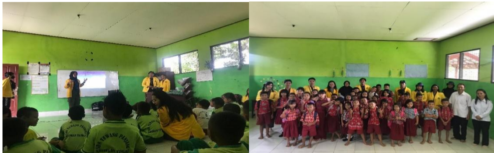
Gambar 5. Pengaruh Penggunaan Gadget Berlebihan dan Dampak Bullying

Penggunaan gadget yang berlebihan dapat memiliki berbagai pengaruh negatif pada individu, terutama anak-anak dan remaja. Bullying adalah tindakan yang sangat merugikan dan tidak bisa dianggap remeh, di usia anak-anak rawan sekali terjadinya bullying satu sama lain.