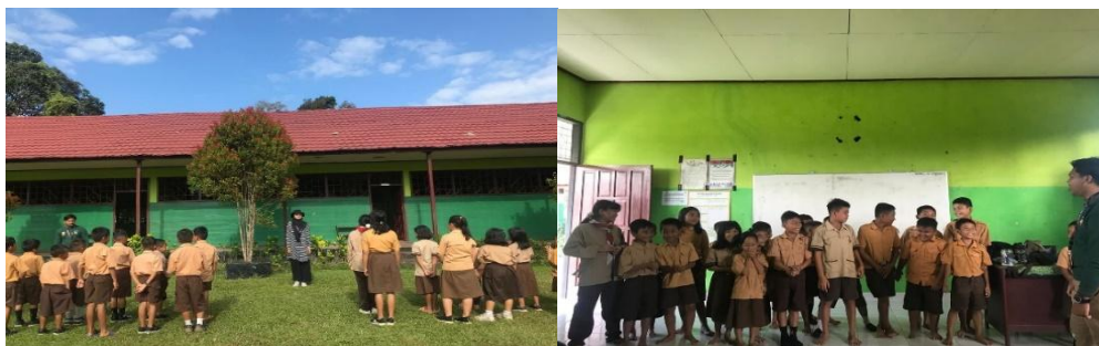
Gambar 6. Kegiatan Pembinaan Karakter

Kegiatan pembinaan karakter anak ini bertujuan untuk mengembangkan nilai-nilai positif pada siswa SDN 1 Tewang Panjang melalui kegiatan ekstrakurikuler Pramuka.