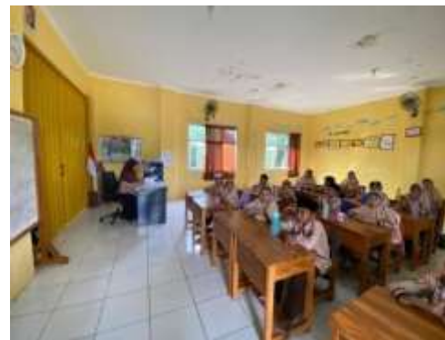
Gambar 4 Pembukaan oleh perwakilan guru

Pada sesi ini, pelatih akan menjelaskan struktur dan komponen hasil karya ilmiah serta argumentasinya. Pelatih menjelaskan perbedaan antara hasil dan pembahasan serta menjelaskan bagaimana data ditampilkan dalam hasil dengan menggunakan tabel, grafik, dan penjelasan. Teknik penulisan diskusi akan dibahas, termasuk interpretasi data, relevansi dengan literatur, dan implikasi terhadap pelatihan. Kami juga membahas kesalahan umum yang harus dihindari saat menulis hasil dan diskusi.