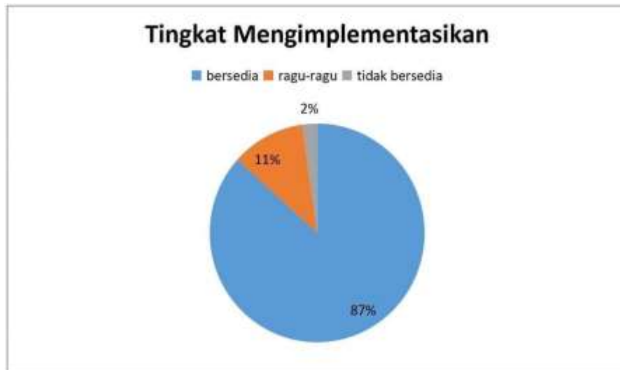
Gambar 7 Tingkat ketersediaan peserta mengimplementasikan dalam keseharian

Kemudian kami juga memberikan kuisioner terkait apakah para peserta berkeinginan untuk berbagi dan juga mengimplementasikannya dalam keseharian. Keterbatasan penguasaan materi ini juga menyebabkan Dengan demikian, pelatihan dan pendampingan ini diharapkan dapat meningkatkan kemampuan peserta dalam merangkum hasil dan mendiskusikan makalah akademis mengenai pelatihan komunikasi efektif bagi siswa sekolah dasar, serta berkontribusi pada perkembangan sosial dan akademik anak-anak.