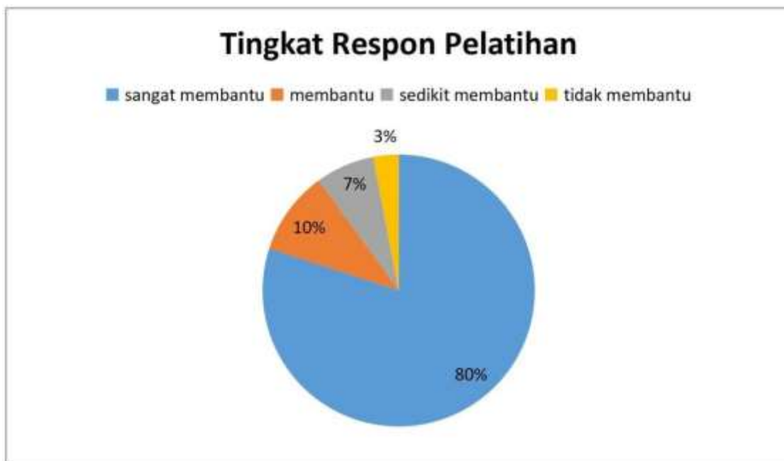
Gambar 6 Respon peserta pelatihan

Setelah seluruh materi diberikan, tim membagikan kuisioner untuk mengumpulkan data seputar tanggapan dari peserta terkait pelatihan yang telah kami berikan. Data ini yang akan dijadikan pedoman evaluasi kegiatan PKM agar dapat kualitas dan ketercapaian tujuan PKM ditingkatkan lagi .