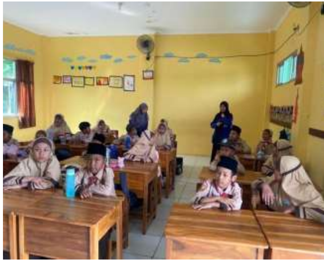
Gambar 5 sesi tanya jawab