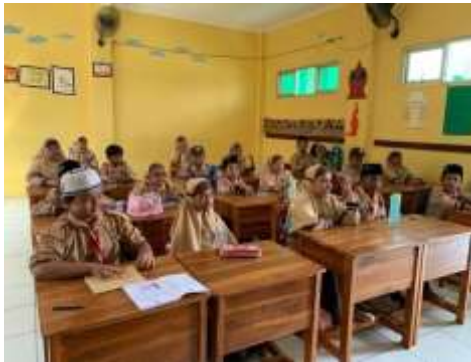
Gambar 3 Peserta memasuki ruangan kegiatan

Pelatihan dimulai dengan sesi pembukaan selama 15 menit. Pada sesi ini, pelatih akan memperkenalkan diri dan meminta peserta untuk memperkenalkan diri. Pelatih juga akan menjelaskan tujuan dan harapan pelatihan serta menguraikan agenda pelatihan. Sesi Teori Kedua, Sesi teori berlangsung 45 menit.