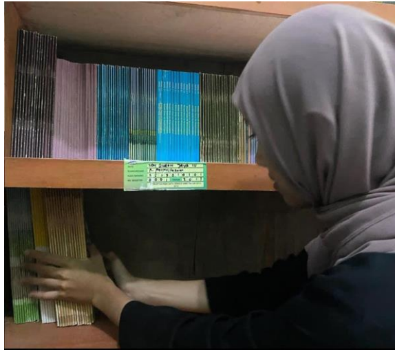
Gambar 2. Kegiatan Merapikan dan Menyortir Buku di Perpustakaan

Pada awal pelaksanaan kegiatan kunjungan perpustakaan, peserta didik sangat antusias ketika memasuki perpustakaan. Mereka diberikan tugas untuk membaca 1 buku yang mereka minati kemudian akan diminta untuk menjelaskan kembali isi dari buku tersebut. Di akhir kegiatan, para peserta didik mengaku sangat senang karena perpustakaan sekolah mereka sudah memiliki banyak buku yang sesuai dengan minat membaca mereka, dan perpustakaan di hias sangat menarik sehingga mereka senang berlama-lama di dalam perpustakaan serta menghilangkan stigma bahwa membaca itu membosankan. Kunjungan perpustakaan ini hanya dapat dikunjungi ketika jam istirahat, agar tidak mengganggu jam belajar mereka di kelas.