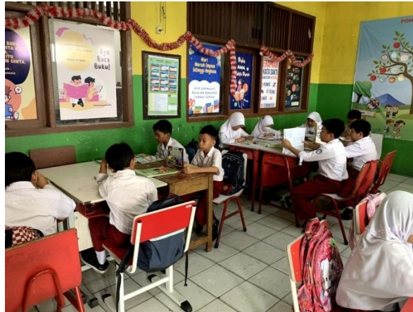
Gambar 4. Kegiatan Membaca 15 Menit

Selain dua program literasi tersebut, mahasiswa kampus mengajar juga membuat program numerasi yaitu bimbingan belajar (bimbel) numerasi. Bimbel numerasi ini lebih di prioritaskan untuk kelas V dan VI, karena dua jenjang kelas tersebut yang memiliki banyak kesulitan di bidang numerasi, salah satu kesulitan yang dirasakan yaitu kurangnya pemahaman konsep terhadap pembelajaran matematika yang guru berikan dan juga sebagian dari peserta didik belum bisa perkalian. Sebelum melaksanakan program tersebut, mahasiswa kampus mengajar 6 menyiapkan strategi serta membuat media pembelajaran yang sesuai dengan kebutuhan peserta didik sehingga pembelajaran terasa sangat menyenangkan. Kegiatan ini dilaksanakan dengan dibagi menjadi dua sesi, untuk sesi pertama untuk kelas V, dan sesi ke-dua untuk kelas VI. Pembelajaran yang diberikan menyesuaikan dengan materi pembelajaran yang sedang mereka pelajari. Mereka sangat senang ketika mengikuti kegiatan ini dan merasa bahwa matematika tidak terlalu sulit. Mahasiswa kampus mengajar 6 menggunakan strategi permainan seperti berburu ubur-ubur agar peserta didik merasa nyaman belajar dengan kami.