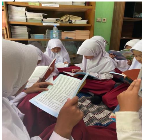
Gambar 3. Kunjungan Perpustakaan

Pada awal pelaksanaan kegiatan kunjungan perpustakaan, peserta didik sangat antusias ketika memasuki perpustakaan. Mereka diberikan tugas untuk membaca 1 buku yang mereka minati kemudian akan diminta untuk menjelaskan kembali isi dari buku tersebut. Di akhir kegiatan, para peserta didik mengaku sangat senang karena perpustakaan sekolah mereka sudah memiliki banyak buku yang sesuai dengan minat membaca mereka, dan perpustakaan di hias sangat menarik sehingga mereka senang berlama-lama di dalam perpustakaan serta menghilangkan stigma bahwa membaca itu membosankan. Kunjungan perpustakaan ini hanya dapat dikunjungi ketika jam istirahat, agar tidak mengganggu jam belajar mereka di kelas.