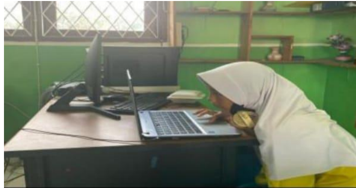
Gambar 6. Kegiatan AKM (Assesmen Kompetensi Minimum)

September 2023, sedangkan Post-Test dilaksanakan pada tanggal 14-15 November 2023. Pada saat pelaksanaan Pre-Test sempat mengalami kendala jaringan, sehingga membuat para peserta didik menunggu terlalu lama, tetapi hal tersebut tidak mengurangi antusias para peserta didik.