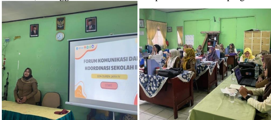
Gambar 1. Pelaksanaan FKKS

Tahapan kedua yaitu pelaksanaan program. Kegiatan ini diawali dengan melaksanakan koordinasi mahasiswa kampus mengajar 6 bersama dengan pihak sekolah melalui kegiatan FKKS (Forum Komunikasi dan Koordinasi Sekolah). Pada kegiatan tersebut, mahasiswa kampus mengajar 6 menyampaikan seluruh rancangan program yang akan dilaksanakan di sekolah, kemudian mahasiswa kampus mengajar 6 juga memberikan kesempatan kepada pihak sekolah untuk memberikan pertanyaan dan saran mengenai rancangan program yang dipaparkan oleh mahasiswa. Setelah berkoordinasi, pihak sekolah menyampaikan bahwa mereka setuju dengan rancangan program yang dibuat oleh mahasiswa yaitu kegiatan kunjungan perpustakaan, membaca 15 menit, dan bimbel numerasi, sehingga mahasiswa sudah dapat melaksanakan program tersebut.