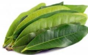
Gambar 2. Daun Salam (Anggraini, 2020)