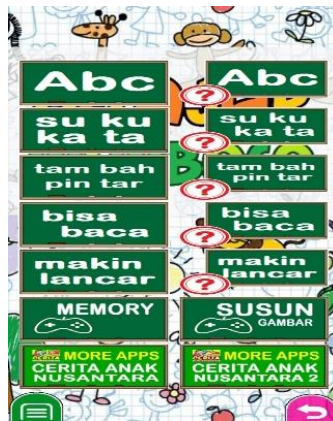
Gambar 2. Tampilan menu aplikasi belajar membaca