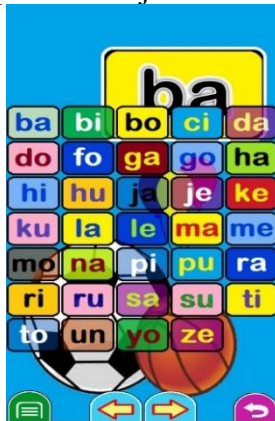
Gambar 4. Tampilan suku kata