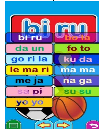
Gambar 6. Tampilan bisa baca