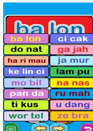
Gambar 7. Tampilan makin lancar

Pada tampilan pertama berisi tentang mengenal alfabet, pada tampilan kedua berisi tentang suku kata seperti “ba, bi, bu, bo, ci, da, do”, pada tampilan ketiga berisi tentang tambah pintar seperti “bas, bil, bra, bun, cak, jan, lam”, pada tampilan keempat berisi tentang bisa baca yang di