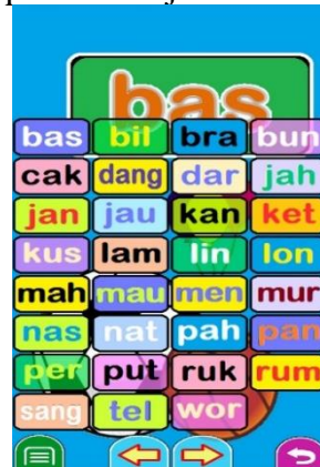
Gambar 5. Tampilan tambah pintar