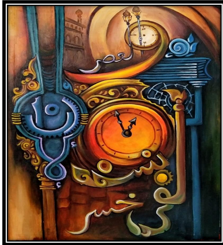
Gambar Karya Lukisan “Terlambat Memperbaiki” (Sumber. Nur Zaitun, 2024)

Judul : Terlambat Memperbaiki Ukuran : 60 x 80 cm Media : Cat akrilik diatas kanvas Tahun : 2024 Pelukis : Nur Zaitun