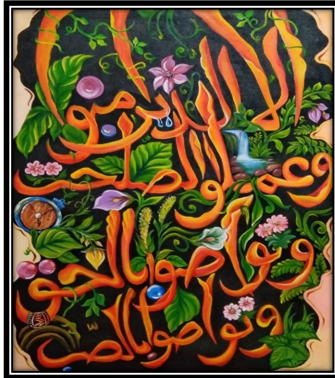
Karya Lukisan “Semak Belukar” (Sumber. Nur Zaitun, 2024)

Judul : Semak Belukar Ukuran : 60 x 80 cm Media : Cat akrilik diatas kanvas Tahun : 2024 Pelukis : Nur Zaitun