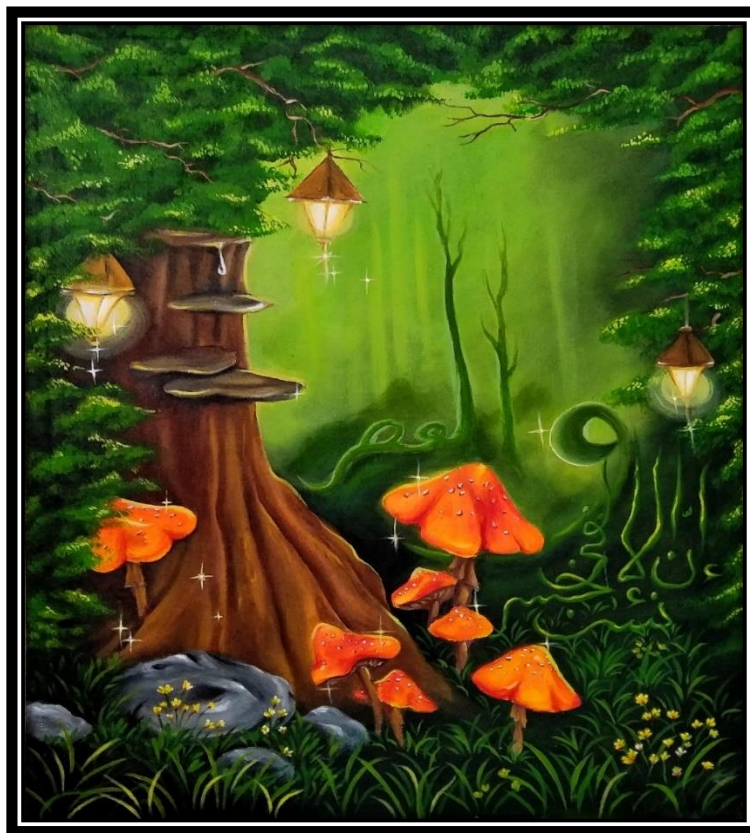
Karya Lukisan “Hutan Pun Tahu” (Sumber. Nur Zaitun, 2024)

Judul : Hutan Pun Tahu Ukuran : 60 x 80 cm Media : Cat akrilik diatas kanvas Tahun : 2024 Pelukis : Nur Zaitun