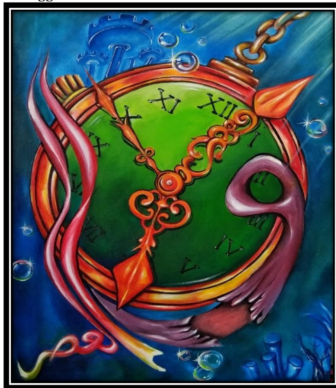
Karya Lukisan “ Tenggelam ” (Sumber. Nur Zaitun, 2024)

Judul : Tenggelam Ukuran : 60 x 80 cm Media : Cat akrilik diatas kanvas Tahun : 2024 Pelukis : Nur Zaitun