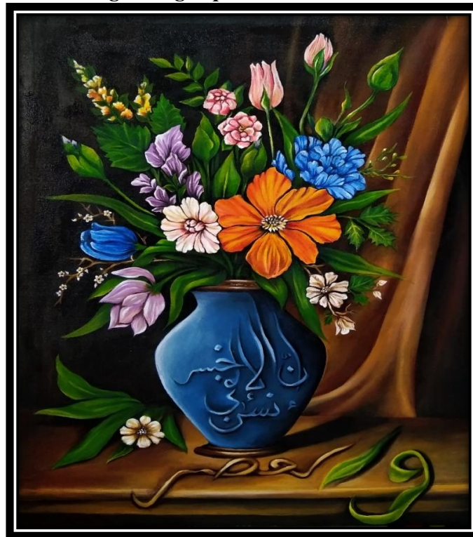
Karya Lukisan “ Ibarat Bunga Yang Dipetik ” (Sumber. Nur Zaitun, 2024)

Judul : Ibarat Bunga Yang Dipetik Ukuran : 60 x 80 cm Media : Cat akrilik di atas kanvas Tahun : 2024 Pelukis : Nur Zaitun