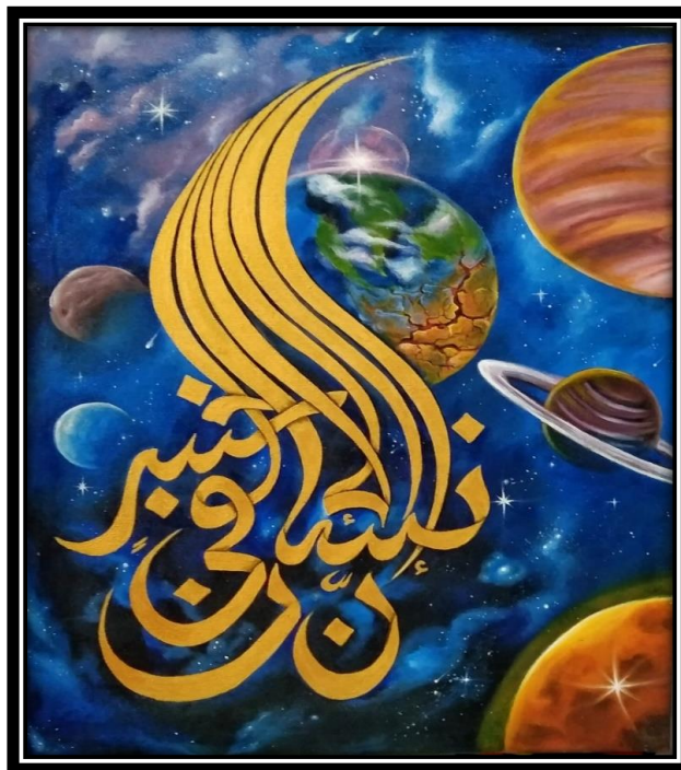
Karya Lukisan “Binasa” (Sumber. Nur Zaitun, 2024)