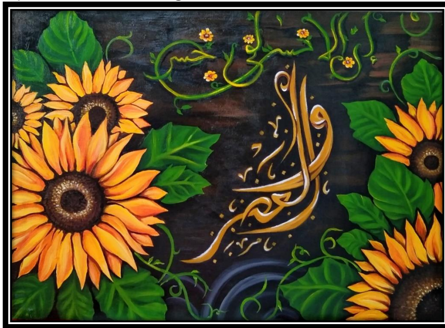
Karya Lukisan “Waktu dan Bunga Matahari” (Sumber. Nur Zaitun, 2024)

Judul : Waktu dan Bunga Matahari Ukuran : 60 x 80 cm Media : Cat akrilik diatas kanvas Tahun : 2024 Pelukis : Nur Zaitun