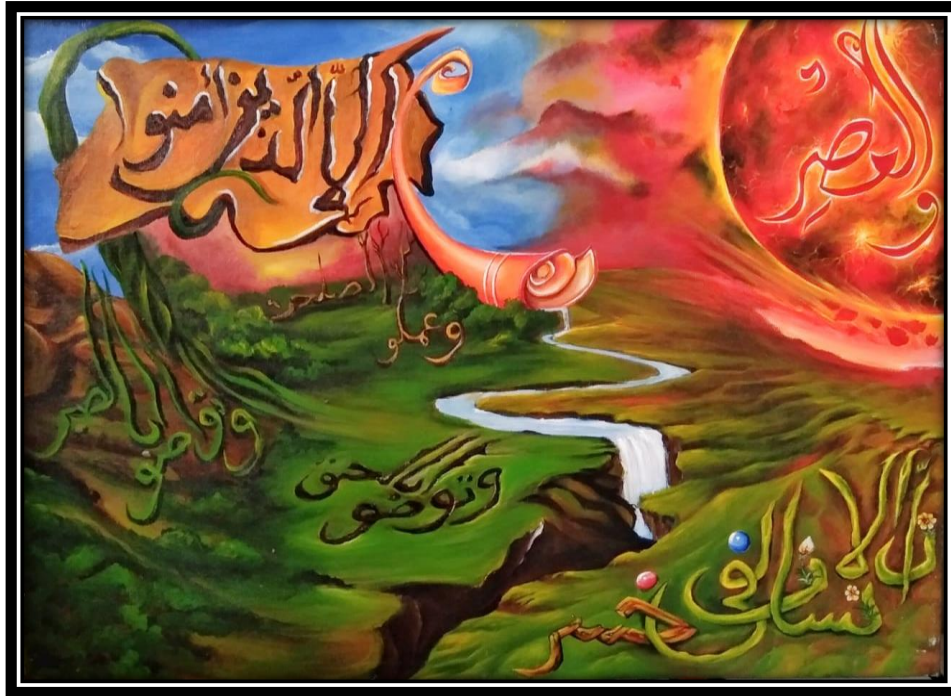
Karya Lukisan “Pada Masanya” (Sumber. Nur Zaitun, 2024)

Judul : Pada Masanya Ukuran : 60 x 80 cm Media : Cat akrilik diatas kanvas Tahun : 2024 Pelukis : Nur Zaitun