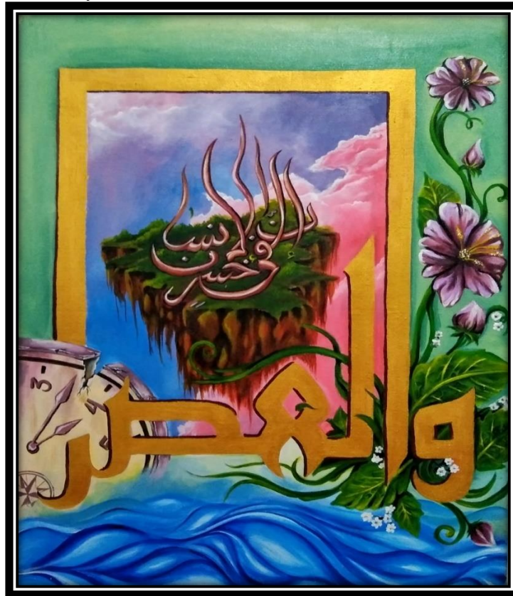
Karya Lukisan “Khayalan” (Sumber. Nur Zaitun, 2024)

Judul : Khayalan Ukuran : 60 x 80 cm Media : Cat akrilik diatas kanvas Tahun : 2024 Pelukis : Nur Zaitun