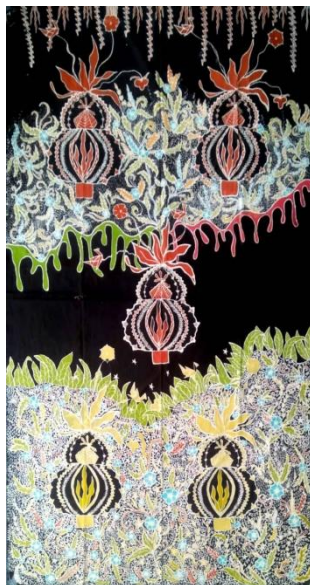
Hasil Karya batik tulis 8 (foto: Lisa Santika Putri,2024)

Pencipta :Lisa Santika Putri Judul :kembang si mayang Ukuran :200x105