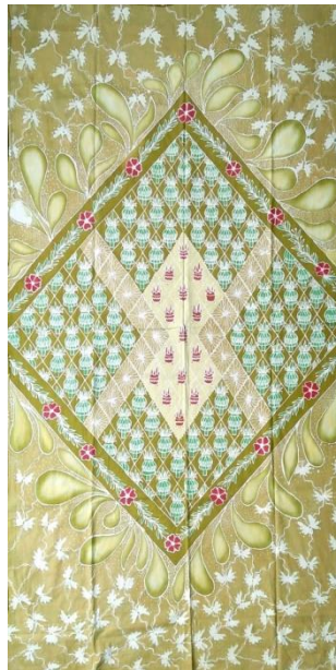
Hasil Karya batik tulis 1

Pencipta :Lisa Santika Putri Judul :Kupat Mayang Ukuran :200x105 Teknik :Teknik coleh bahan pewarna remasol Media :Kain mori Tahun :2024