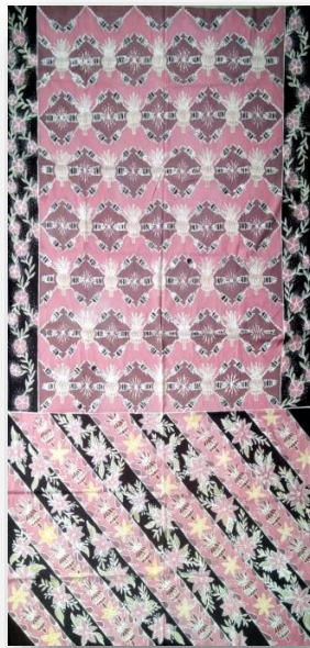
Hasil karya batik tulis 10