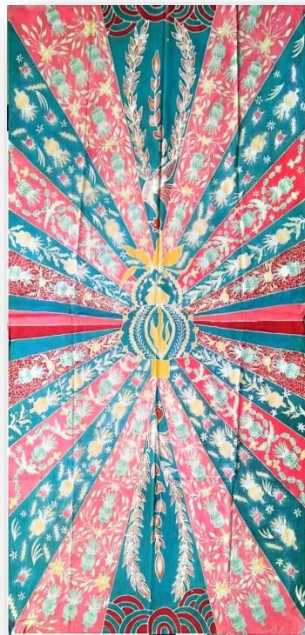
Hasil Karya batik tulis 9