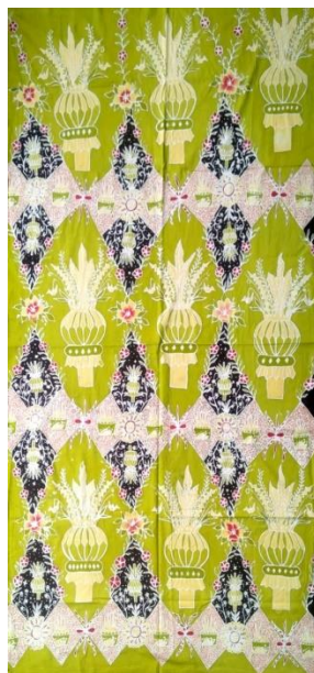
Hasil Karya batik tulis 4

Pencipta :Lisa Santika Putri Judul :Gadingan Mayang Ukuran :200x105 Teknik :Teknik coleh bahan pewarna remasol Media :Kain mori Tahun :2024