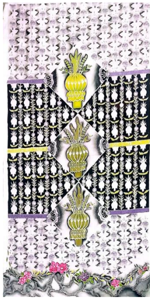
Hasil karya batik tulis 12