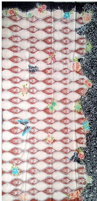
Hasil Karya Batik Tulis 6