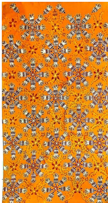
Hasil karya batik tulis 11