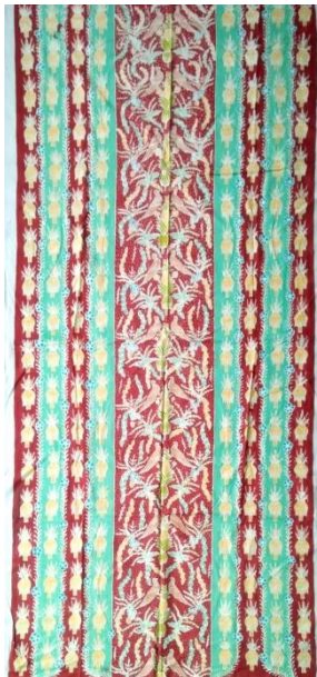
Hasil Karya Batik Tulis 2

Pencipta :Lisa Santika Putri Judul :kembang abang Ukuran :200x105 Teknik :Teknik colet bahan pewarna remasol Media :Kain mori Tahun :2024