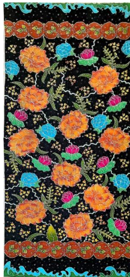
Hasil karya batik tulis 9

Pencipta : Annisa Judul : Bayangan diri Ukuran : 250x115 cm Teknik : Teknik colet bahan pewarna remasol Media : kain mori primissima Tahun : 2024