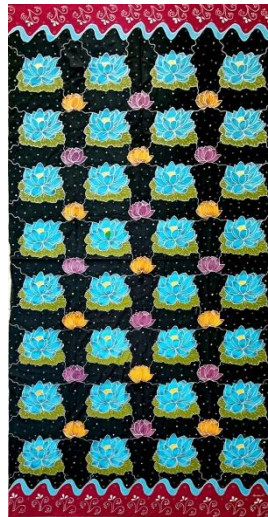
Hasil karya batik tulis 8

Pencipta : Annisa Judul : Persamaan Ukuran : 250x115 cm Teknik : Teknik colet bahan pewarna remasol Media : kain mori primissima Tahun : 2024