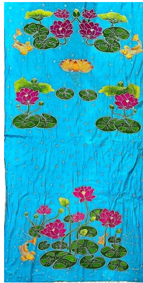
Hasil karya batik tulis 10

Pencipta : Annisa Judul : Puncak kehidupan Ukuran : 250x105 cm Teknik : Teknik colet bahan pewarna remasol Media : kain mori primissima Tahun : 2024