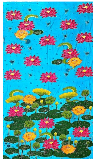
Hasil karya batik tulis 3

Pencipta : Annisa Judul : Kekuatan dasar Ukuran : 250x115 cm Teknik : Teknik colet bahan pewarna remasol Media : kain mori primissima Tahun : 2024