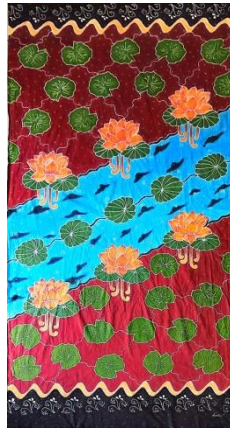
Hasil karya batik tulis 7

Pencipta : Annisa Judul : Puncak keberhasilan Ukuran : 250x105 cm Teknik : Teknik colet bahan pewarna remasol Media : kain mori primissima Tahun : 2024