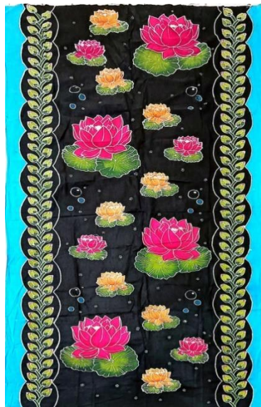
Hasil karya batik tulis 1

Pencipta : Annisa Judul : Ketahanan Ukuran : 200x105 cm Teknik : Teknik colet bahan pewarna remasol