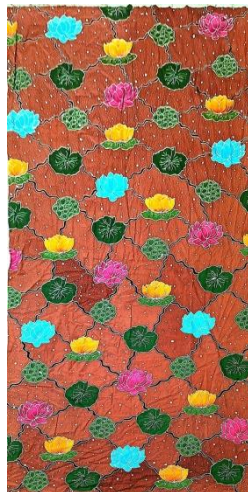
Hasil karya batik tulis 4

Pencipta : Annisa Judul : Teratai sulur Ukuran : 250x115 cm Teknik : Teknik colet bahan pewarna remasol