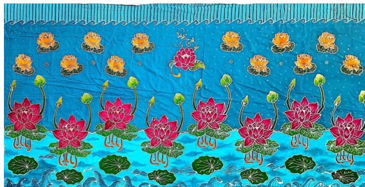
Hasil karya batik tulis 11