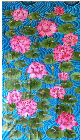
Gambar 4.24 Hasil karya batik tulis 12