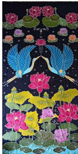
Hasil karya batik tulis 6

Pencipta : Annisa Judul : Puncak keberhasilan Ukuran : 250x105 cm Teknik : Teknik colet bahan pewarna remasol Media : kain mori primissima Tahun : 2024