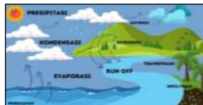
Gambar 2. Tahapan Siklus Air