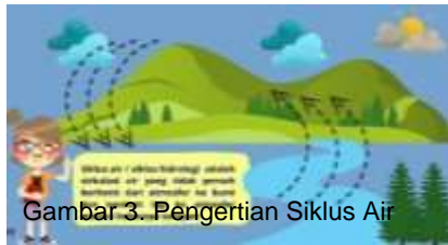
Gambar 3. Pengertian Siklus Air