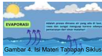
Gambar 4. Isi Materi Tahapan Siklus Air