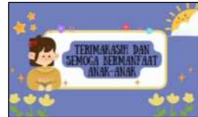
Gambar 6. Tampilan Penutup