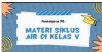
Gambar 1. Tampilan Halaman Cover

Berikut ini adalah desain yang akan digunakan pada media pembelajaran digital berbasis motion graphic pada materi siklus air yang akan dikembangkan pada penelitian ini.