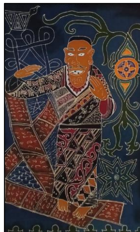
Gambar 4. 2 Karya Batik 2 Sibayak (Sumber: Yedija Pratama Muham, 2024)

Judul : Sibayak Karya batik : Yedija Pratama Muham Ukuran : 90 cm x 115 cm Skala :1/10 Media : Kain Mori Primisima Tahun : 2024