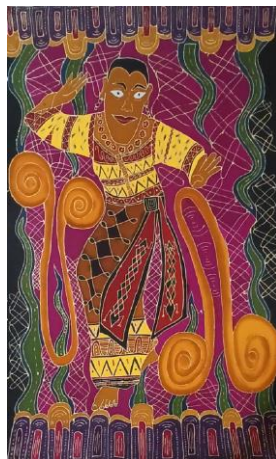
Gambar 4. 4 Karya Batik 4 Beru