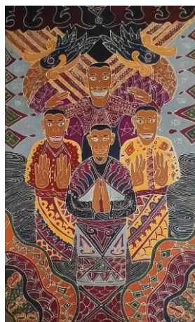
Gambar 4. 11 Karya Batik 10 Gundala Gundala