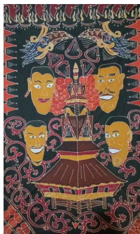
Gambar 4. 1 Karya Batik 1