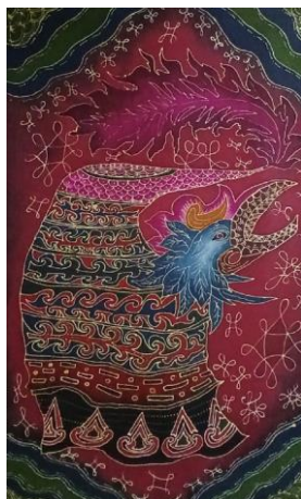
Gambar 4. 8 Karya Batik 8 Gurda Gurdi Ngagas