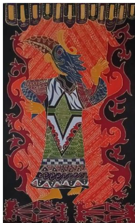
Gambar 4. 6 Karya Batik 6 Anak Perana Si Ertuah