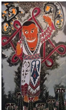
Gambar 4. 5 Karya Batik 5 Puanglima