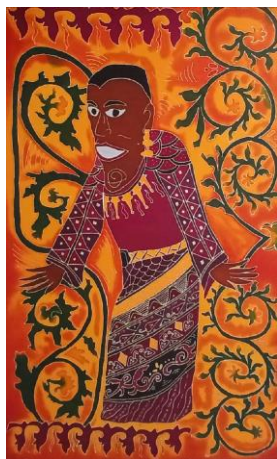
Gambar 4. 3 Karya Batik 3 Kemberahen Raja