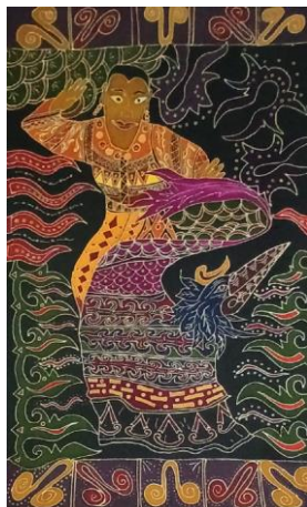
Gambar 4. 7 Karya Batik 7 Ngelangar Sarat