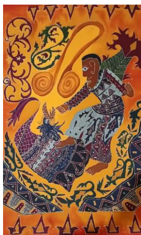
Gambar 4. 10 Karya Batik 11 Talu