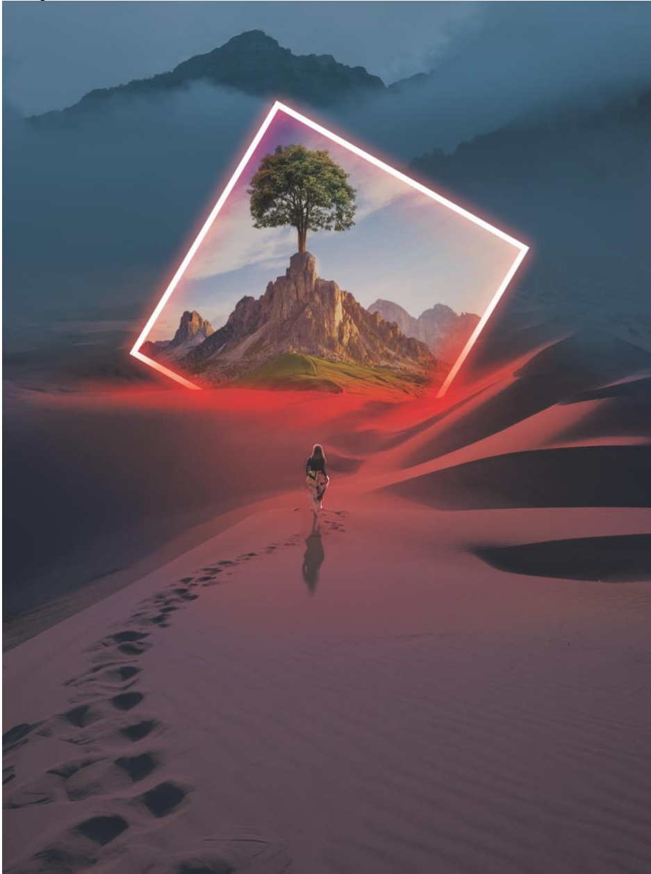
Gambar 4. 10 Take Me Back To Your World