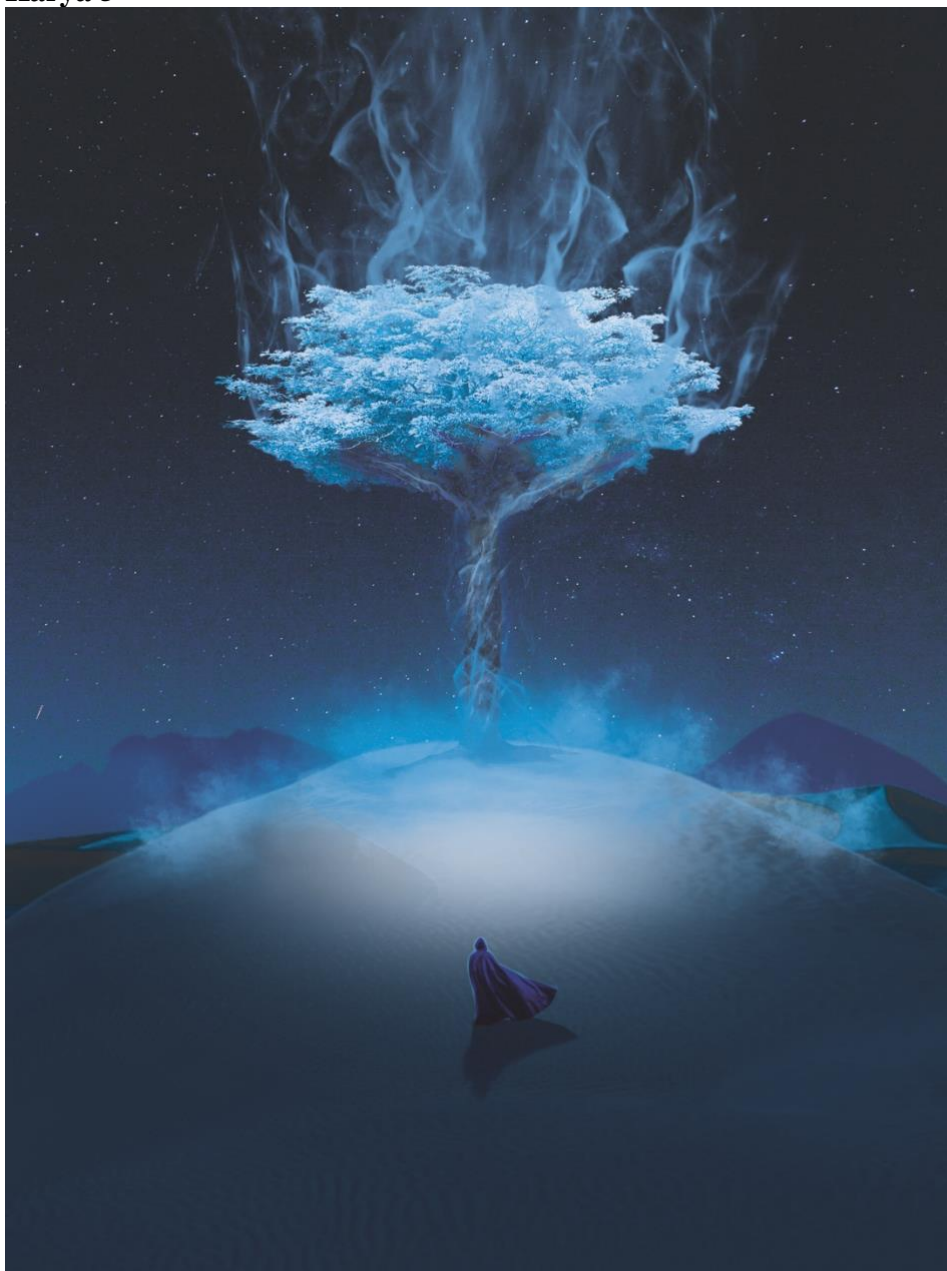
Gambar 4. 5 Yggdrasil