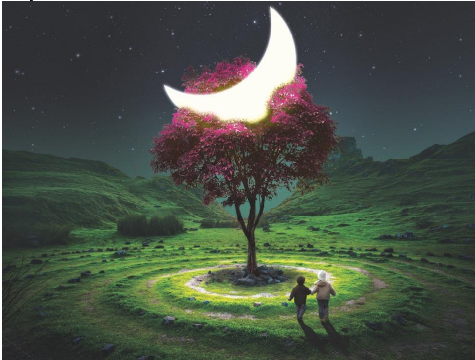
Gambar 4. 9 The Missing Piece