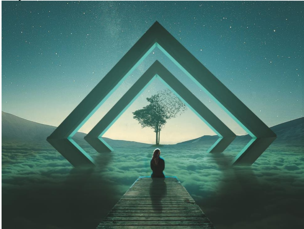
Gambar 4. 8 Now, I See You