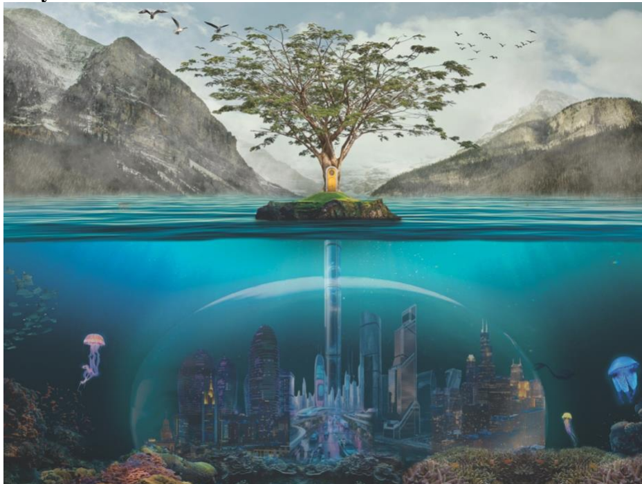
Gambar 4. 4 Unpredictable