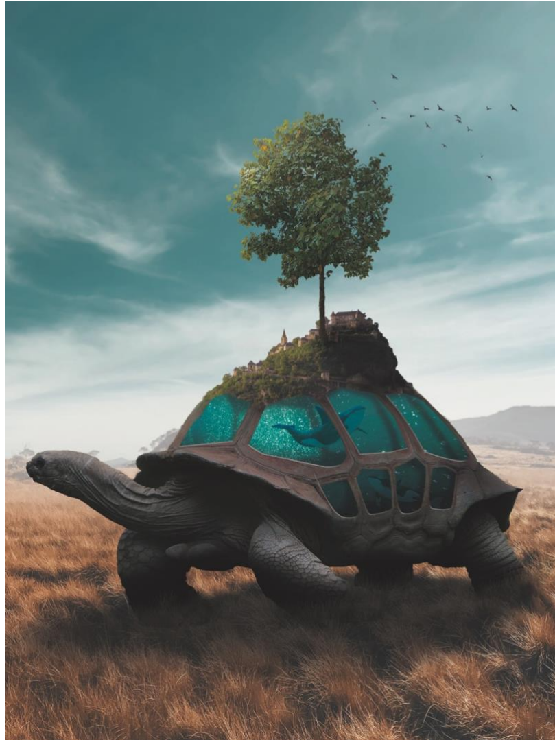
Gambar 4. 3 The Shelter