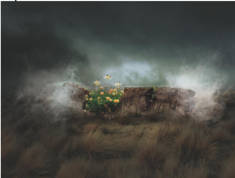
Gambar 4. 7 The Beginning of an End