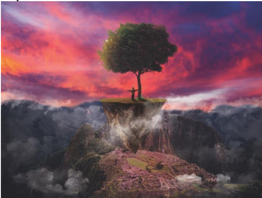
Gambar 4. 6 My Savior Media : paper