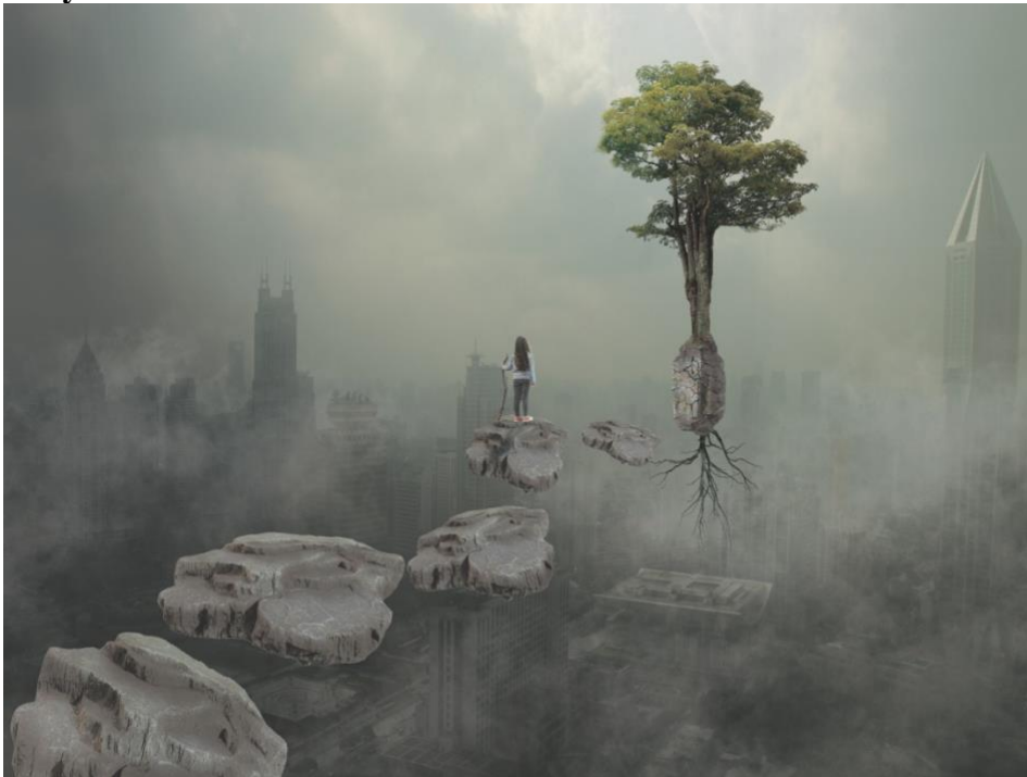
Gambar 4. 12 The Path