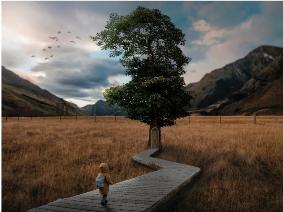
Gambar 4. 1 Home