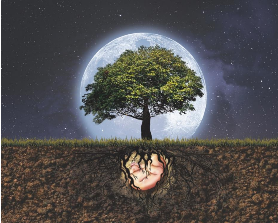
Gambar 4. 2 Embrio