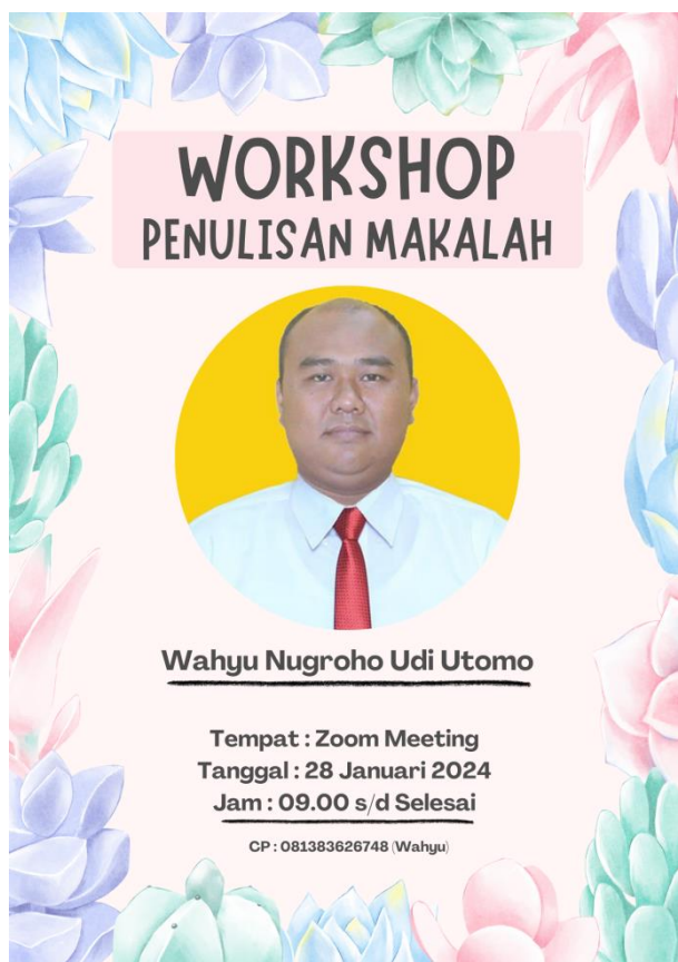
Gambar 1. Poster Workshop Penulisan Makalah