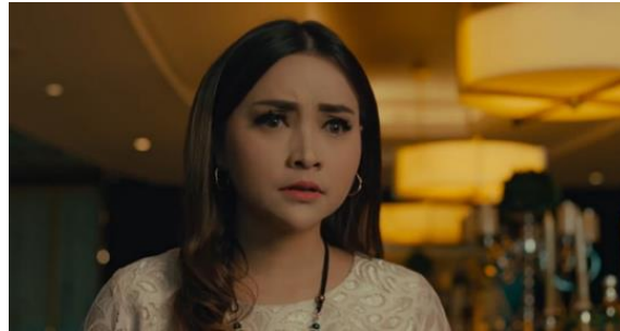
Dialog adegan 9, menit 01.28.35 :

Aldo : “Mak, Mak. Itu papanya Indah yang nolongin aku”.