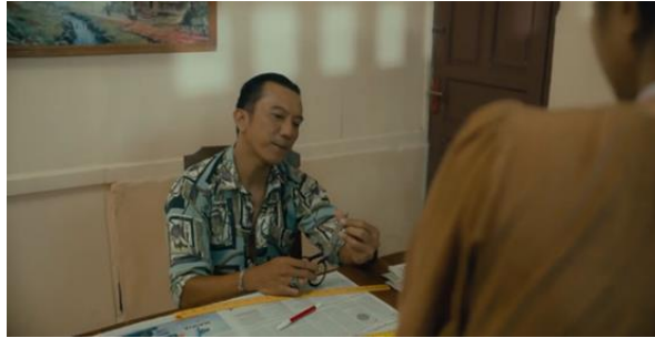
Dialog adegan 9, menit 00.17.11 :

Rentenir : “Oh iya iya. Eh kedatangan saya kesini sebenarnya mau meminta uang yang dipinjam suami kamu sebesar 10 juta. Eh dia janji akan mengembalikan dan saya nggak bisa nunggu lama”.