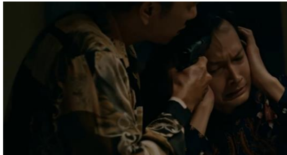
Dialog adegan 4, menit 00.37.54 :

Rentenir : “Tolong kasih dua 2 M. Hahaha. Utang lu aja yang kemarin belum lu bayar. Sekarang mau ngutang lagi”.