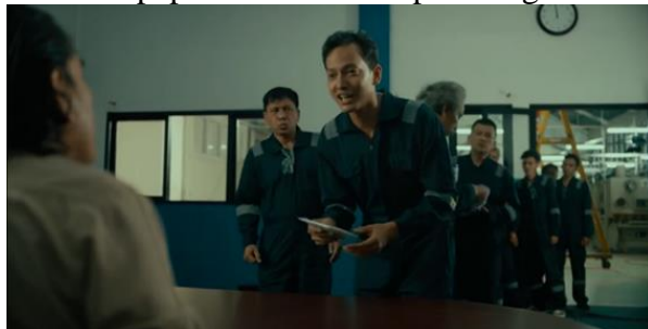
Dialog adegan 4, menit 00.05.51 :

Jono : “Maaf pak ini nggak salah. Bulan kemarin kan saya sering lembur kok, upahnya gak sesuai ya?”