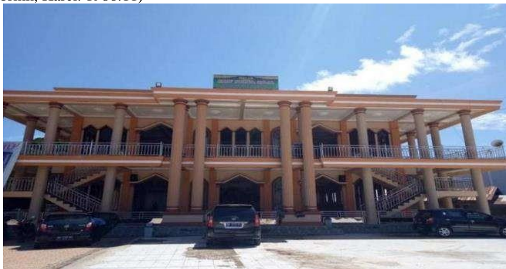
Gambar 1.4 (Masjid Pesantren Nurul Jalal)

Pada masa kepemimpinan KH. Muhammad Mansur bin Hamzah, pesantren Nurul Jalal mulai melakukan pembangunan, pertama beliau membangun masjid pesantren yang tidak hanya digunakan oleh para santri tetapi juga bisa dimanfaatkan oleh masyarakat sekitar pesantren dan memperluas bangunan pesantren sehingga bisa lebih baik digunakan untuk Pendidikan, ini dikarenakan murid di pesantren Nurul Jalal yang bertambah walaupun juga tidak diketahui jumlah pastinya, namun pada masa kepemimpinan KH. Muhammad Mansur jumlah guru di pondok pesantren masih sangat kurang, terlebih guru yang mengajar ilmu pengetahuan umum. Banyak guru yang memegang mata pelajaran lebih dari satu, sehingga guru dipaksa agar mampu menguasai pengetahuan diluar keilmuan yang dia miliki. Permasalahan ini dianggap wajar untuk lembaga pendidikan yang tergolong baru berdiri. Mencari tenaga pengajar yang memiliki ijazah S1 Pendidikan atau sarjana pendidikan pada era tahun 1990an tidak mudah. Terlebih yang dicari adalah tenaga pengajar yang tidak hanya mengerti ilmu umum tetapi juga harus memahami ilmu agama. (Steenbrink, Karel. 1986:11)