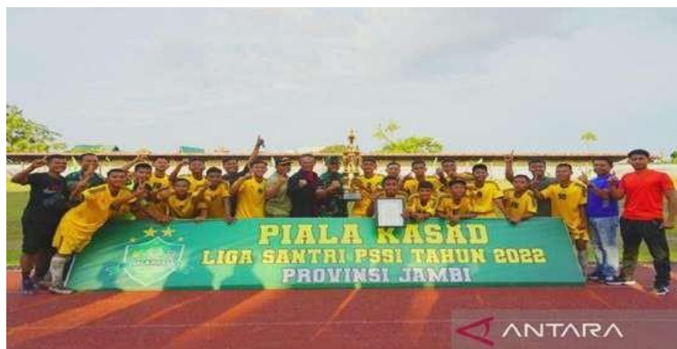
Gambar 1.9 (Juara Piala KASAD LIGA SANTRI PSSI 2022)

Pada tahun 2022 setelah pandemi covid 19 Pesantren Nurul Jalal berhasil meraih banyak prestasi salah satunya yaitu Kesebelasan Pondok Pesantren Nurul Jalal berhasil mewakili Provinsi Jambi ke putaran tingkat nasional Liga Santri Piala Kasad Tahun 2022. Dari beragam prestasi para santrinya membuktikan bahwa pesantren Nurul Jalal telah mengalami banyak sekali kemajuan. (Amin dan M. Ishom El Saha. 2004:24).