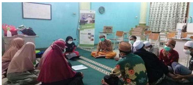
Gambar 1.7 (kegiatan para santri Pesantren Nurul Jalal)

Pada masa kepemimpinan H. M. Fauzi Manshur, masalah kekurangan guru telah diatasi atas kerja sama yang dilakukan yayasan Pondok Pesantren Nurul Jalal. Lembaga pendidikan Islam Pondok Pesantren Nurul Jalal senantiasa berkomitmen untuk meningkatkan kualitas hasil belajar dan lulusan santrinya (siswanya). Berkaitan dengan hal tersebut, guna meningkatkan kualitas pembelajaran, usaha yang dilakukan adalah bekerjasama dengan beberapa instansi termasuk pemerintahan Kabupaten Tebo dalam memenuhi kebutuhan tenaga pengajar. Selain itu, pihak yayasan juga lebih selektif dalam menerima guru yang diterima sebagai tenaga pengajar. Tujuannya tidak lain adalah untuk meningkatkan kualitas Pondok Pesantren Nurul Jalal dan melahirkan Sumber Daya Manusia yang berkualitas serta berakhlak mulia. Pada masa kepemimpinan Fauzi Mansyur cukup banyak kemajuan yang terjadi pada pesantren Nurul Jalal, diantaranya terjadi perluasan dan renopasi bangunan asrama karena semakin banyaknya santri yang mengenyam Pendidikan di pesantren Nurul Jalal sehingga memaksa pesantren Nurul Jalal untuk memperluas pembangunan asrama dan area sekolah, pembangunan perpustakaan hingga pembangunan laboratorium untuk sekolah MA, dibangunnya sekolah MI Nurul Jalal, dan tepat pada tahun 2016 dibukanya sekolah MI Nurul Jalal yang berkembang hingga sekarang. (Azra, Azyumardi. 2003:20).