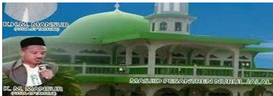
Gambar 1.3 (KH. Muhammad Mansur bin Ustman, Masjid Nurul Jalal)

Pada masa kepemimpinan KH. Muhammad Mansur bin Hamzah, pesantren Nurul Jalal mulai melakukan pembangunan, pertama beliau membangun masjid pesantren yang tidak hanya digunakan oleh para santri tetapi juga bisa dimanfaatkan oleh masyarakat sekitar pesantren dan memperluas bangunan pesantren sehingga bisa lebih baik digunakan untuk Pendidikan, ini dikarenakan murid di pesantren Nurul Jalal yang bertambah walaupun juga tidak diketahui jumlah pastinya, namun pada masa kepemimpinan KH. Muhammad Mansur jumlah guru di pondok pesantren masih sangat kurang, terlebih guru yang mengajar ilmu pengetahuan umum. Banyak guru yang memegang mata pelajaran lebih dari satu, sehingga guru dipaksa agar mampu menguasai pengetahuan diluar keilmuan yang dia miliki. Permasalahan ini dianggap wajar untuk lembaga pendidikan yang tergolong baru berdiri. Mencari tenaga pengajar yang memiliki ijazah S1 Pendidikan atau sarjana pendidikan pada era tahun 1990an tidak mudah. Terlebih yang dicari adalah tenaga pengajar yang tidak hanya mengerti ilmu umum tetapi juga harus memahami ilmu agama. (Steenbrink, Karel. 1986:11)