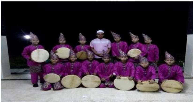
Gambar 1.8 (Kegiatan kesenian marawis)

Bukan hanya kegiatan agama saja yang dilakukan oleh para santri, mereka juga diajarkan melestarikan kesenian islam dan melayu seperti kesenian kompiang, marawis, dan robana. Hal ini dilakukan oleh pihak pesantren agar kesenian melayu Jambi khususnya Tebo tetap terjaga hingga masa yang akan datang, karena dizaman sekarang kesenian melayu cukup sulit untuk di temui dikarenakan anak-anak muda hanya sibuk dengan hanpone sehingga jika tidak dilestarikan maka kesenian melayu akan hilang seiring berkembangnya zaman. (Amin dan M. Ishom El Saha, 2004:18).