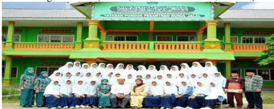
Gambar 1.1 (Pesantren Nurul Jalal kabupaten Tebo)

Pesantren Nurul Jalal merupakan pesantren pertama yang berdiri dikabupaten tebo yang dirintis oleh KH.Z ahruddin bin Ustman pada tahun 1994, Awal berdirinya pesantren nurul jalal hanyalah sebuah bangunan sederhana yang di khususkan untuk menghafal Al-quran, kemudian KH.Zahrudin bin Ustman memiliki ide untuk mwmbuka madrasah pada tahun 1995 agar anak-anak dan remaja di sekitar tempat tinggalnya bisa mempelajari ilmu agama islam, ini dikarenakan pada saat itu masyarakat Tebo sangat minim akan pemahaman ilmu agama islam. (Hendra, Gunawan Baharudin, 2020:11)