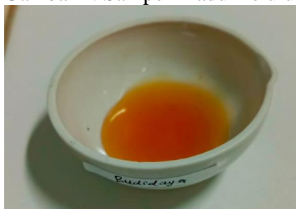
Gambar 2. Sampel Madu Kelulut

Teknik pengambilan sampel digunakan adalah random sampling . Beberapa jenis madu dianalisis kemudian di pilih salah satu jenis madu yang sesuai dengan kriteria penulis dan seberapa sering masyarakat mengkonsumsinya, kemudian pilihan tersebut jatuh pada madu kelulut. Dengan menggunakan teknik random sampling yang membuat setiap sampel dalam anggota populasi memiliki peluang yang sama untuk dipilih sebagai sampel uji penelitian sehingga di dapatkan sampel yaitu madu kelulut.