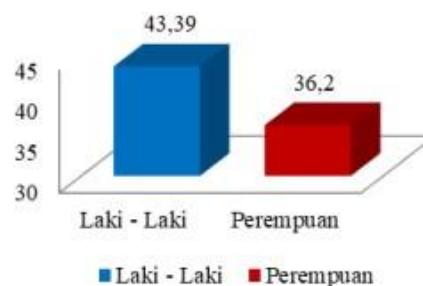
Gambar 1. Persentase Tenaga Kerja Formal (Sumber: BPS, 2022)

Perpajakan berbasis gender (GBT) menerapkan tarif pajak yang lebih rendah pada tenaga kerja perempuan, yang memiliki elastisitas lebih tinggi. Inisiatif Perpajakan Berbasis Gender (GBT) yang didorong dalam Presidensi G20 Indonesia bertujuan untuk memberikan keistimewaan pada perempuan di dunia kerja melalui kebijakan pajak yang afirmatif, seperti tarif pajak marginal yang lebih rendah dan insentif bagi perempuan yang melahirkan. GBT didasarkan pada bukti bahwa perempuan memiliki elastisitas pasokan tenaga kerja yang lebih tinggi. sehingga perubahan kebijakan pajak dapat membantu menutup kesenjangan gender dalam partisipasi dan pendapatan. Ketimpangan gender di Indonesia masih berlangsung karena struktur sosial yang dipengaruhi oleh sejarah, tradisi, dan budaya patriarki. Dalam sistem ini, laki-laki sering kali memegang kekuasaan lebih besar, yang menyebabkan diskriminasi dan penindasan terhadap perempuan. Hal ini menghambat potensi dan peran perempuan di berbagai sektor, termasuk keluarga, masyarakat, pendidikan, dan dunia kerja. Penelitian menunjukkan bahwa masalah ini masih meluas dan mempengaruhi banyak aspek kehidupan.