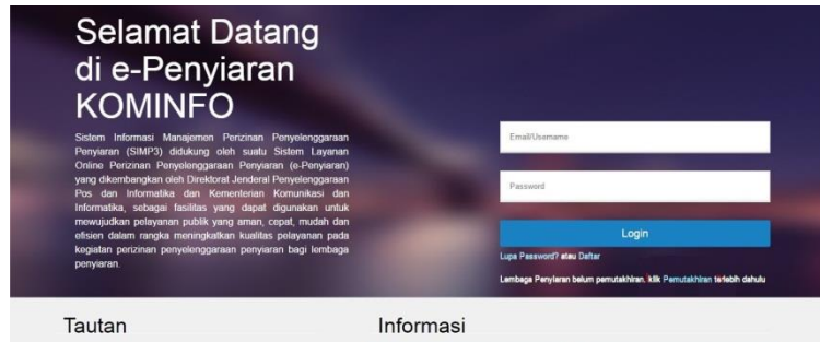
Gambar 1.1 : Tampilan Website SIMP3 lama.

berhubungan dengan penyarannya, yaitu OSS, SIMP3, Monev (Laporan Tahunan LPS) dan Akun ISR (dulunya bernama spectra web). Proses perizinan Lembaga Penyiaran Radio Swasta ini mulai tahun 2017 diberlakukan secara online dengan membuat akun SIMP3 di website www.e-penyiaran.kominfo.go.id . Website ini merupakan website resmi yang disediakan Kementerian Komunikasi dan Informatika RI khusus untuk perizinan Penyelenggaraan Penyiaran.